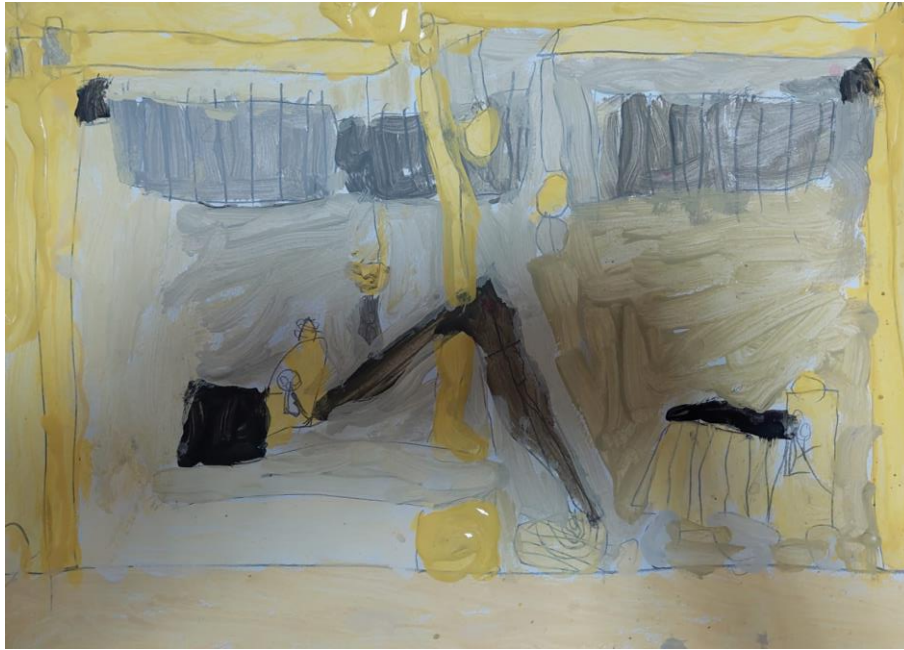
Slika 4. Slikarski rad sedmogodišnjeg dječaka Dominika: „Sve dizalice, bageri i kamioni su u žuto i ja kad narastem ću raditi na gradilištu.”

Rad sedmogodišnjeg dječaka Dominika sadrži još više detalja u usporedbi s prva dva rada, što i nije čudno s obzirom na to da je taj dječak stariji od djece koja su naslikala prva dva analizirana rada. Kako je dječak sam naveo, odabrao je žutu boju, a tu žutu boju povezuje s pozitivnim emocijama, odnosno s gradilištem i strojevima na gradilištu na kojem se i on nada zaposliti kada odraste. Žuta je boja Sunca te se veže za toplinu, veselje i optimizam. Ipak, može imati i negativne konotacije, pa često asocira na bolest kod ljudi. U kombinaciji s drugim bojama često asocira na nered, razuzdanost, ili čak na ludilo. Najtoplija je i najsjajnija boja, motivira mentalne procese i rad živčanog sustava, poboljšava pamćenje i potiče komunikaciju (Brenko i sur., 2009). Prema tome, u prikazanom primjeru žuta boja ima isključivo pozitivne konotacije.