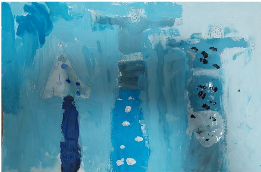
Slika 3. Slikarski rad djevojčice Mire (5 godina i 5 mjeseci): „Ja i mama se smijemo zbog bora i poklona, ovdje piše Mira, a ovamo nešto drugo.”

o pozitivnom iskustvu, točnije kako je dijete naslikalo neki pozitivan trenutak iz vlastitog života, može se zaključiti da je u tom slikarskom radu dijete pozitivne emocije povezalo s toplom bojom, odnosno toplim tonovima narančaste boje.