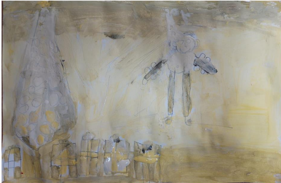
Slika 5. Slikarski rad dječaka Šime (6 godina i 3 mjeseca): „To ja vidim poklone pod borom, pa sam sretan.”

Slikarski rad dječaka Šime (u trenutku slikanja tog rada dječak je imao 6 godina i 3 mjeseca) prikazuje njega samoga kako je uočio poklone pod borom, pri čemu dječak navodi da je zbog tog događaja sretan. I taj je dječak, baš kako je prikazano u prethodnom slučaju, za svoj slikarski rad koristio žutu boju, pa se može zaključiti da je i u prikazanom primjeru žuta kao jedna od toplih boja povezana s pozitivnim emocijama.