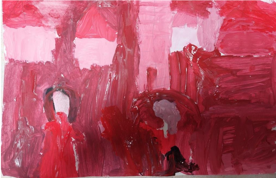
Slika 10. Slikarski rad djevojčice Mihale (6 godina i 10 mjeseci): „Ja i brat kako se dodajemo loptom (ali lopta se pokrila bojom), to je naša zgrada i kuće okolo i sunce je u kutu.”

Na prethodnoj je slici prikazan rad djevojčice Mihale koja za vrijeme ovog istraživanja imala 6 godina i 10 mjeseci. I ona je za slikanje trenutka iz vlastitog života koji u njoj izaziva sreću koristila crvenu boju. Na slici je prikazana sama djevojčica u društvu brata. Djeca se dodaju loptom ispred svoje zgrade. S obzirom na konotacije koje crvena boja izaziva, očekivano bi bilo crvenu boju povezivati s pozitivnim emocijama kada se autor rada želi referirati na romantičnu ljubav, ali kod djevojčice to nije slučaj. No, kao prethodni uradak, tonovi ružičaste imaju pozitivnu konotaciju.