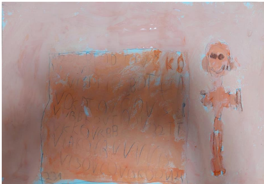
Slika 2. Rad petogodišnjeg dječaka Lovre: „Ja čitam i brat sluša na slušalicama.“

U nastavku su prezentirani i analizirani dječji slikarski radovi prema principu egzemplarnosti. Treba napomenuti da određeni radovi nisu dovršeni jer se aktivnost morala nastaviti drugi dan u predškolskoj ustanovi, pri čemu su tog sljedećeg dana kada se aktivnost nastavila neka djeca izostala. Stoga ti radovi nisu uvršteni u analizu.