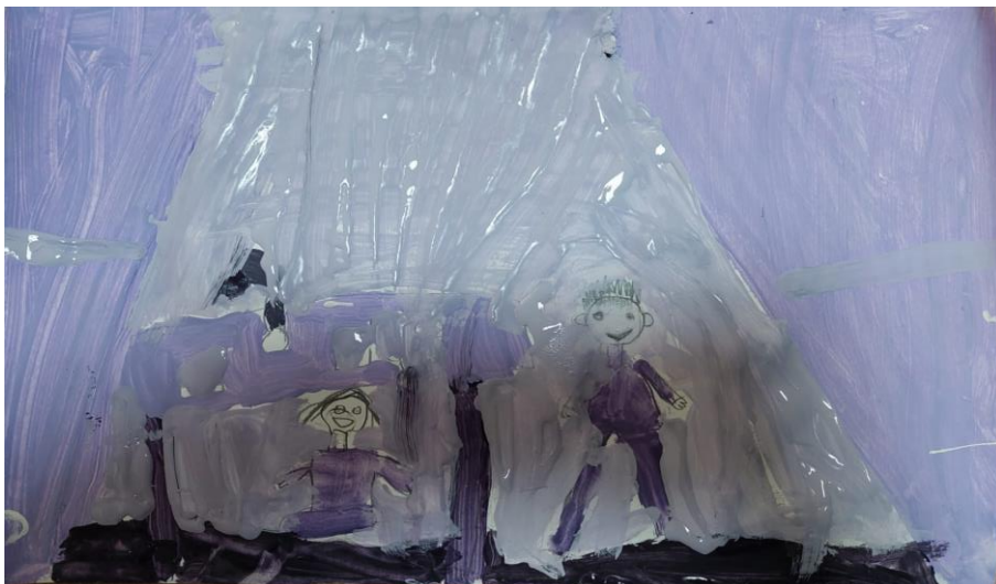
Slika 6. Slikarski rad djevojčice Roze (6 godina i 7 mjeseci): „Ja i brat radimo nešto od papira. Ja sam se sakrila ispod stola da ga prepadnem, ali on me vidio, pa se nasmijao.”

Slikarski rad dječaka Šime (u trenutku slikanja tog rada dječak je imao 6 godina i 3 mjeseca) prikazuje njega samoga kako je uočio poklone pod borom, pri čemu dječak navodi da je zbog tog događaja sretan. I taj je dječak, baš kako je prikazano u prethodnom slučaju, za svoj slikarski rad koristio žutu boju, pa se može zaključiti da je i u prikazanom primjeru žuta kao jedna od toplih boja povezana s pozitivnim emocijama.