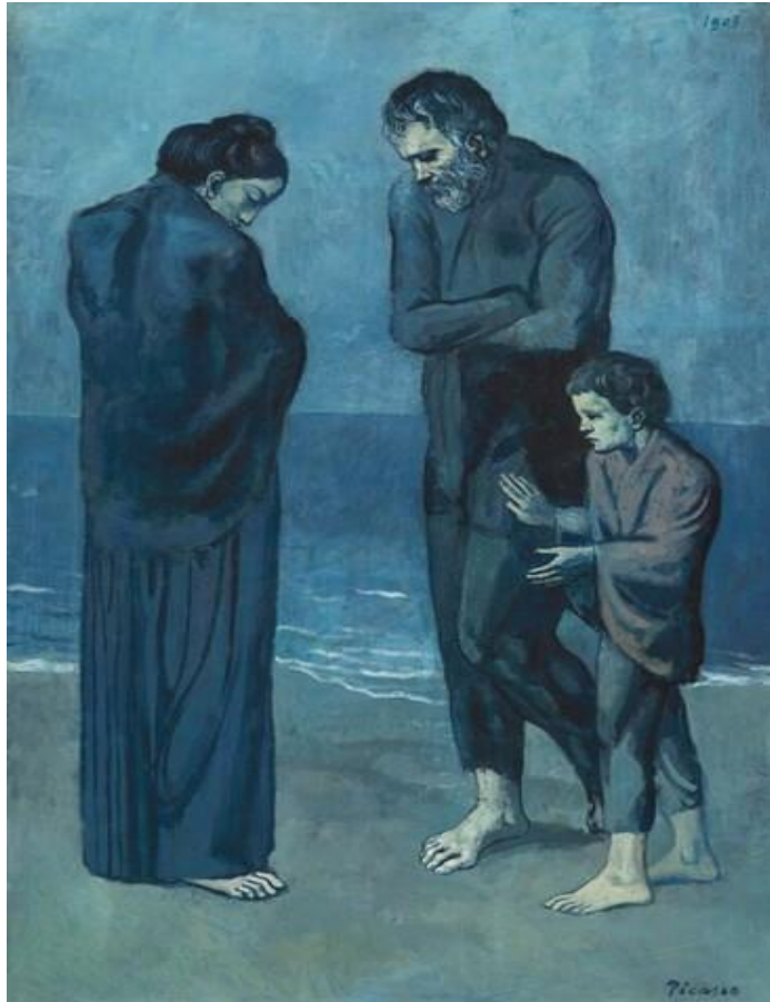
Slika 1. Tragedija Pabla Picassa