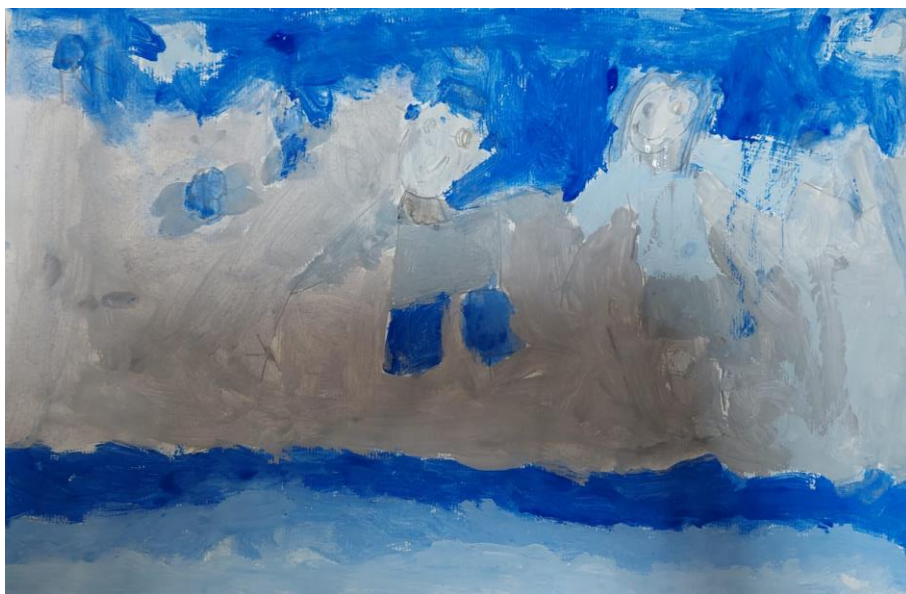
Slika 7. Slikarski rad djevojčice Edite (5 godina i 8 mjeseci): „Mama i tata idu kada je lijepo vrijeme družiti se sami, bacaju kamenčiće u vodu i oni su sretni. Ovo su more, oblaci, leptirica i sunce. Mama je sretna zbog bubamare i što je vidjela svojeg muža nakon posla.”

Na radu koji je naslikala djevojčica Roza (6 godina i 7 mjeseci) prikazani su Roza i njezin brat kako se igraju s papirom. Roza se skriva ispod stola kako bi prepala brata, ali ju je on uhvatio te se nasmijao njezinom pokušaju da ga prepadne. Na temelju Rozina slikarskog rada vidljivo je da je riječ o radu koji pripada fazi razvijene sheme jer su djeca na slici detaljno prikazana. Djevojčica je u izradi tog rada koristila ljubičastu boju, a kako je prikazana aktivnost, odnosno dječja igra koja kod nje budi pozitivne emocije, može se zaključiti da Roza ljubičastu boju povezuje sa sretnim trenucima. Mnogi ljubičastu boju povezuju s nježnošću, pa nije čudno da se ta boja kod djece predškolske dobi može povezati s pozitivnim emocijama.