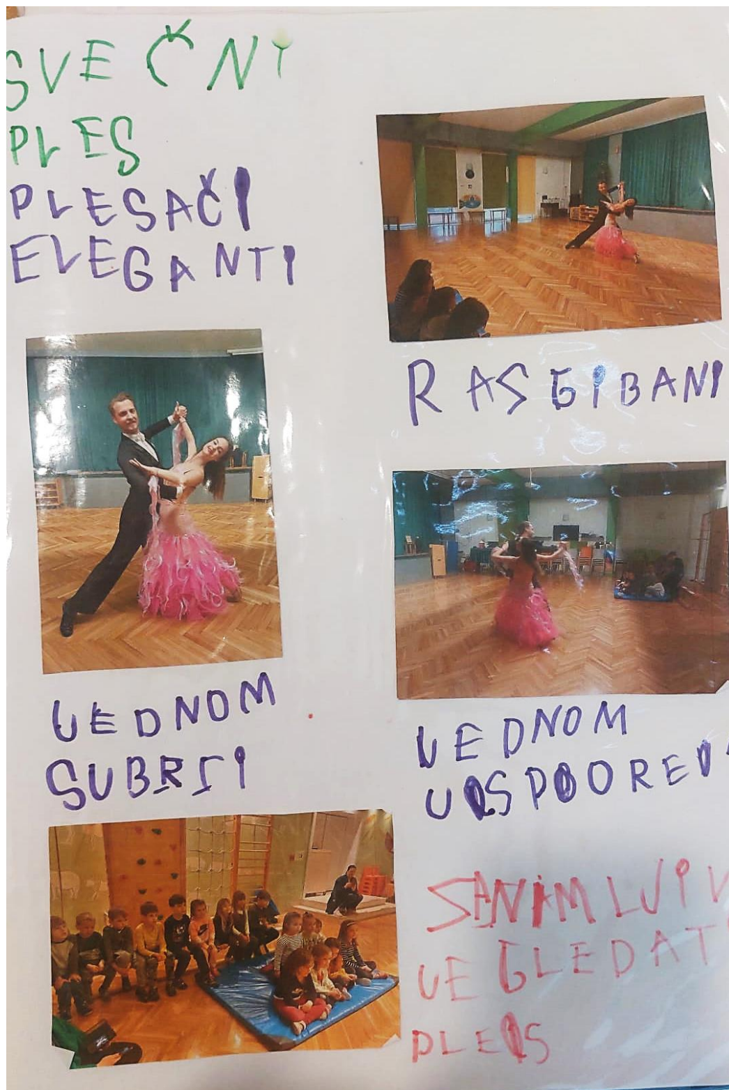
Slika broj 6. Prikaz i mape projekta Posjet plesnog para

Nakon svakoga posjeta plesača, glazbenika i pjevača, odgojiteljice su fotografije i snimke tih posjeta djeci prikazivale u sobi, kako bi im to stalno bilo dostupno te su dalje promišljale koje aktivnosti ponuditi obuhvaćajući sva područja djetetova razvoja. Djeca su u