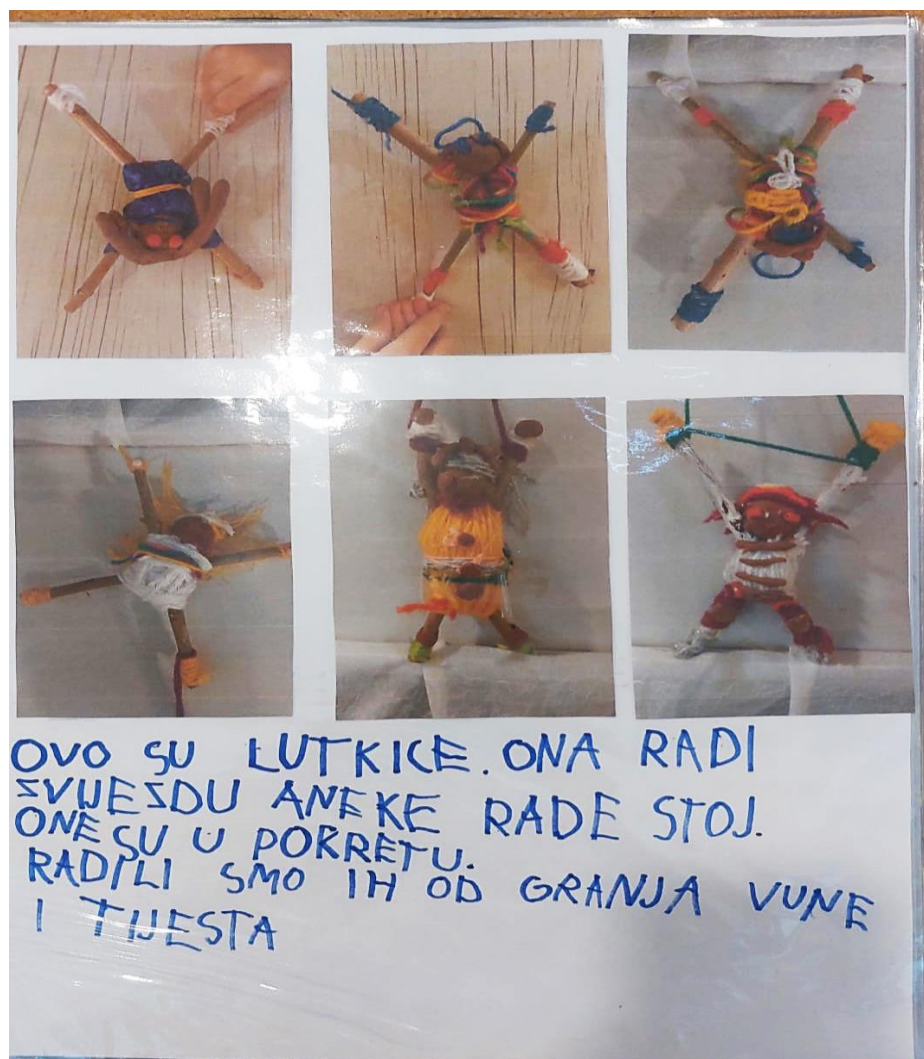
Slika broj 5. Prikaz aktivnosti iz mape projekta koju djeca sama dokumentiraju

U vremenu Božića kao prigodna aktivnost pokazao se posjet Hrvatskom narodnom kazalištu. Djeca su prisustvovala probi baletnih plesača koji su uvježbavali scenu iz baleta Orašar . Povratkom u vrtić idućih dana, odgojiteljice su u likovnom centru ponudile vunu, žice i plasteline. Materijali, koje su ponudile djeci, su poznati iz prethodnih likovnih aktivnosti. Odgojiteljice često u periodu zime nude djeci aktivnosti u kojima manipuliraju rukama raznim materijalima. S obzirom na to doživljaje iz posjeta kazalištu i promatranje plesa balerina, djevojčice od spomenutih materijala izrađuju jako zanimljive figure u plesnim pokretima.