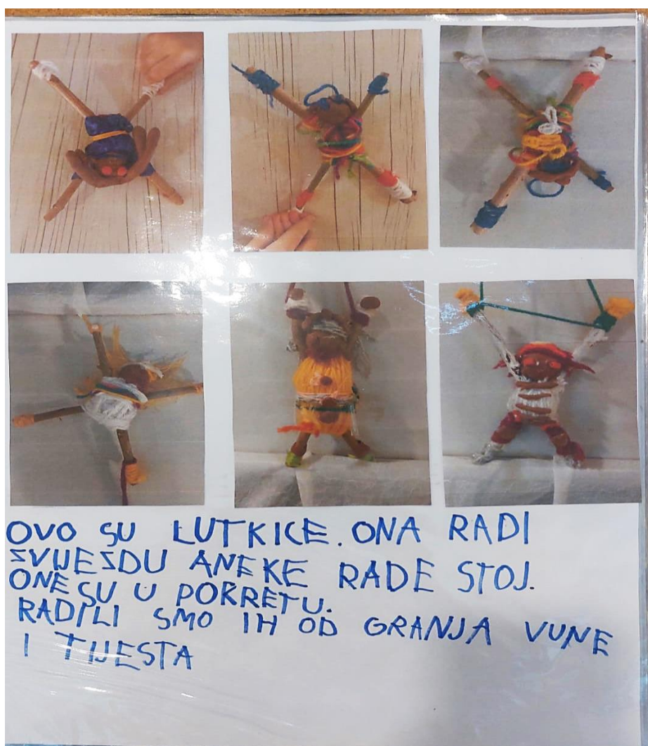
Slika broj 5. Prikaz aktivnosti iz mape projekta koju djeca sama dokumentiraju

U vremenu Božića kao prigodna aktivnost pokazao se posjet Hrvatskom narodnom kazalištu. Djeca su prisustvovala probi baletnih plesača koji su uvježbavali scenu iz baleta Orašar . Povratkom u vrtić idućih dana, odgojiteljice su u likovnom centru ponudile vunu, žice i plasteline. Materijali, koje su ponudile djeci, su poznati iz prethodnih likovnih aktivnosti. Odgojiteljice često u periodu zime nude djeci aktivnosti u kojima manipuliraju rukama raznim materijalima. S obzirom na to doživljaje iz posjeta kazalištu i promatranje plesa balerina, djevojčice od spomenutih materijala izrađuju jako zanimljive figure u plesnim pokretima.