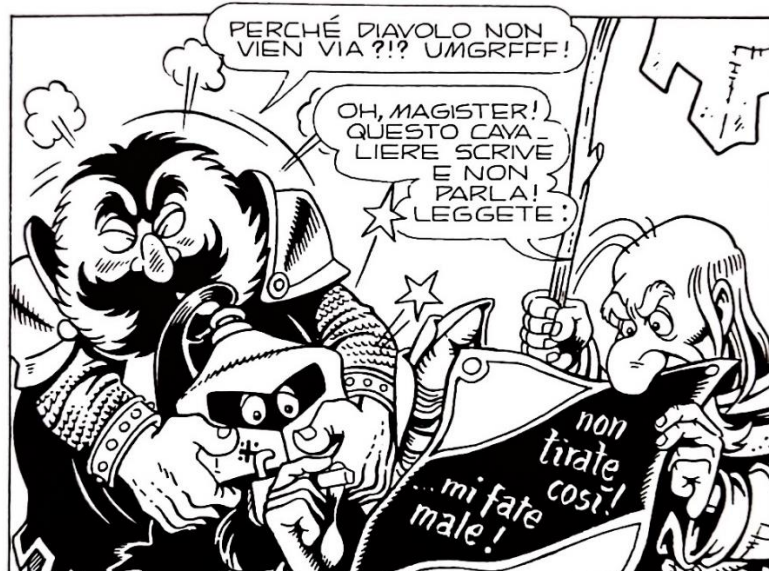
Figura 13: Capitan Golia toglie l'elmo al cavaliere silenzioso

Il cavaliere è così silenzioso che deve scrivere la sfida sul proprio scudo con un gesso, ma non soltanto — continua infatti a usare questo modo di comunicazione per commentare la situazione e, alla fine, per arrendersi. La velocità con cui scrive e l'apparente stabilità della sua mano anche durante condizioni non-ideali (per esempio, mentre Capitan Golia sta aggressivamente tentando di togliergli l'elmo) (fig. 13) 215 sono egualmente umoristiche come il contenuto dei suoi messaggi (dopo la sfida, mentre la compagnia discute su cosa fare, c'è una transizione per mostrare il cavaliere nero tutto minaccioso sul suo cavallo scontroso, e il testo sul suo scudo legge «... e allora?»). 216