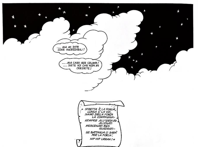
Figura 2: la fine dell'ultimo episodio

Ci trova posto anche la canzone cantata più volte dalla Compagnia: «Stretta è la foglia, lunga è la via / Siam della forca la compagnia... / Sempre all'erta ed allenati / Mercenari ben quadrati... / Se battaglia ci sarà... Per la forca hip hip urrah!» In una occasione, Bertrando aggiunge dopo il verso «Mercenari ben quadrati» la battuta «Mal pagati!» ma viene zittato. 64 La canzone diventa emblematica della Compagnia, un simbolo della vittoria e della solidarietà, e l'inno della serie come tale. Infatti, è appunto con la canzone che finisce l'ultimo episodio (fig. 2).