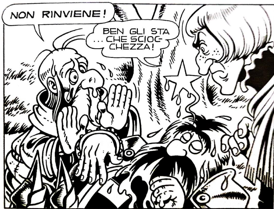
Figura 5: un simbolo del linguaggio fumettistico entra nella diegesi

Succede talvolta che i simboli particolari del medium fumettistico assumono una presenza fisica nel mondo dei personaggi. Ad esempio, la stella che è sospesa sopra la testa di Capitan Golia per comunicare che è svenuto diventa bagnata dopo che Crusca tenta a svegliarlo versandogli sopra un secchio d'acqua (fig. 5). 79 Così viene oltrepassato il confine tra lo spazio extradiegetico e la diegesi.