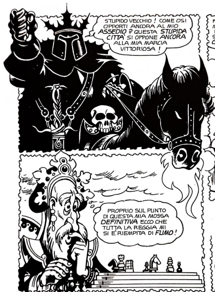
Figura 8: re Cardo e re Giglio

D'altro lato si trovano i personaggi seri, spesso eroici nel senso tradizionale. Si pensi al re di Drasta, Mantello dorato, al suo figlio principe Saltan e al suo leale conte Tra's. Il loro design semplice, con la caricatura tenuta a freno, crea un contrasto con lo zio malefico Kotorsko. Le vesti di Kotorsko sono più dettagliate, per indicare il suo status reale ottenuto in modi disonesti, ma i contorni del suo corpo sono esagerati e le sue smorfie si avvicinano a volte alla grottesca. Il disegno comunica chiaramente al lettore quale personaggio viene preso seriamente e quale serve da comic relief , ovvero se è buono e onesto di natura o corrotto e infido.