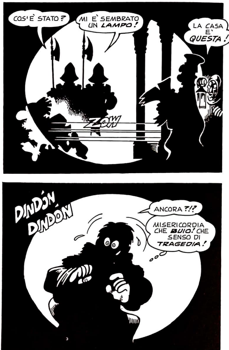
Figura 3: l'inquadratura attraverso il buco nell'inchiestro

sulle pagine opposte, il che crea un senso di vacuità e di apertura ma anche di simmetria. 71 In una scena che si svolge interamente nel buio (cioè, gli sfondi sono neri), i personaggi sono soltanto silhouette nere inquadrare da cerchi bianchi (fig. 3). 72