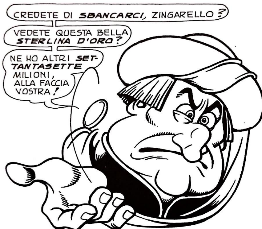
Figura 4: i contorni dell'abbigliamento e le action lines producono l'illusione di un cerchio di inquadratura nel ritratto di Lord Money

semplicemente galleggiano nello spazio vuoto della pagina. 73 Il ritratto di lord Money a pagina 105 de La minaccia del Grande Buio è un esempio interessante perché, sebbene non ci sia un cerchio di sfondo, tutti gli elementi dipinti sono arrangiati in modo di creare l'apparenza di un cerchio — la superficie curvata del cappello si continua attraverso la fascia che ci pende; essa continua per la linea di movimento della moneta gettata per tornare di nuovo al cappello (fig. 4).