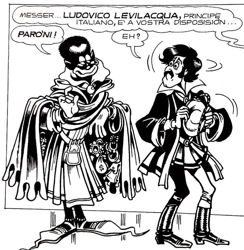
Figura 12: il principe Levilacqua

propria invenzione: «I spick variolingue! » 200 , «Crab sta very dobro! No te gusta, fettentone? Mangia krankio del patrone!» 201