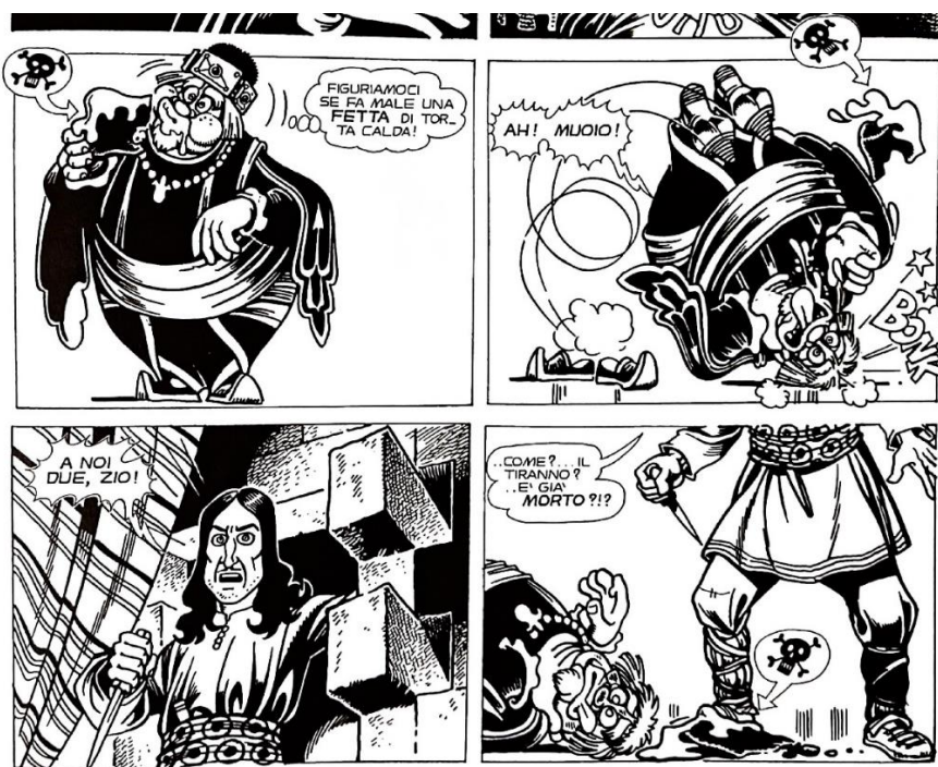
Figura 14: la morte ironica di re Kotorsko

«Figuriamoci se fa male una fetta di torta calda!», dice re Kotorsko quando Ser Ciaccio lo avverte che potrebbe farsi male sulla torta, cioè scottarsi (fig. 14). 264 In realtà, non solo si scotta, ma muore d'improvviso nella vignetta successiva. Le conseguenze della sua incuranza sono comicamente peggiori di quanto si aspettasse, perché la torta era avvelenata. L'ironia è sottolineata ancora di più dal principe Saltan che viene immediatamente dopo, preparato per il classico duello tra il vile usurpatore e il vero re. Però il tiranno è già morto, e a causa del suo stesso veleno.