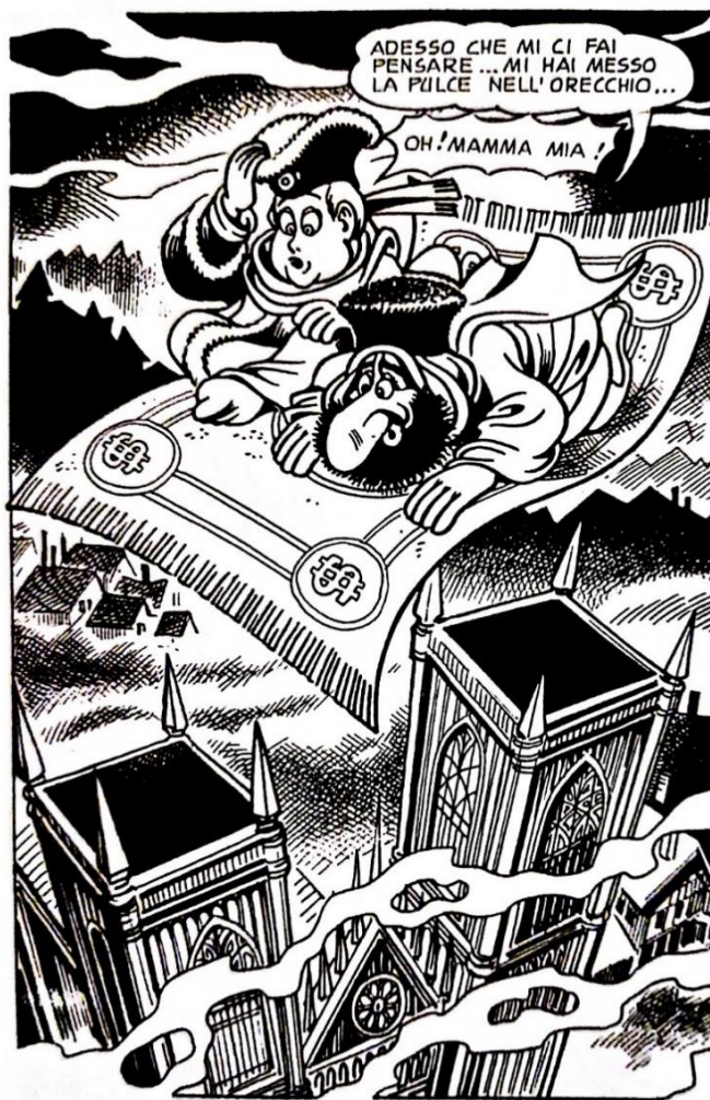
Figura 7: il realismo degli sfondi si oppone al dipinto caricaturistico dei personaggi

Per quanto riguarda lo stile grafico, è condizionato dal contesto storico-sociale, ma anche dal medium in cui è realizzata l'opera e dal suo genere. L'artista è inevitabilmente un prodotto dei suoi predecessori e dalle convenzioni che essi hanno stabilito. Magnus disegnò La Compagnia della Forza nel modo che riflette perfettamente l'atmosfera e la tematica del fumetto. Proprio come la storia, la realizzazione grafica è una via di mezzo tra lo stile cartoony dei fumetti per bambini e quello più elevato dei fumetti d'autore. «I contrasti del chiaroscuro delle matite riproducono in pieno le contese e i conflitti umani, nascondendo dietro l'ironia e la parodia dei luoghi comuni, semplicemente tutte le debolezze dell'uomo.» 90 Il realismo severo degli sfondi pone un accento sulle forme distorte in modo caricaturale dei personaggi e crea un contrasto con elementi grotteschi, esotici e parodici (fig. 7).