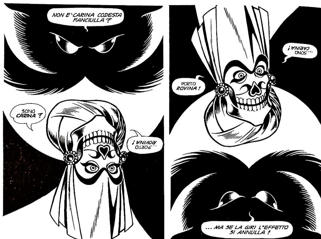
Figura 11: il demone dai due visi

Allo stesso fine serve il demone femminile con due volti che da un angolo sembra una donna bella mentre girandosi prende le sembianze di un teschio (fig. 11). 138 Il testo si rovescia insieme al demone e il lettore è costretto a girare il volume per leggerlo il che pone attenzione ancora una volta alla dimensione fisica dell'oggetto - libro in maniera postmodernista. «Mi fate letteralmente girare la testa!» dice al demone lord Stonewall. 139