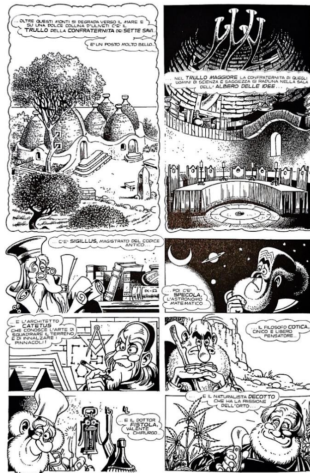
Figura 6: il contrasto simmetrico tra vignette con e senza bordo

La disposizione delle vignette nel fumetto, perciò, spesso crea un effetto di simmetria. A pagina 96 de La minaccia del Grande Buio , si ha sulla sinistra una grande vignetta quadrata con una più piccola, rettangolare, in basso, e la stessa disposizione sulla destra. 87 Questa simmetria è talvolta usata per incorniciare un pezzo della storia; cioè, i Sette Savi sono introdotti attraverso due “splash pages” seguite da sei piccole vignette rettangolari, una per ogni Savio (fig. 6); 88 verso la fine dello stesso volume, quando i Savi fanno la loro ultima apparizione, la disposizione è molto simile — un “two - page spread” seguito ancora da sei vignette, per segnare la chiusura della sottotrama. 89