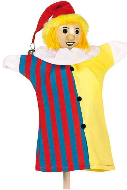
Fotografija broj 2. Javajka. 2