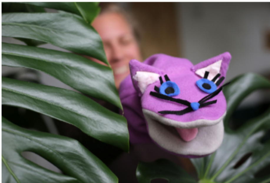
Fotografija broj 5. Lutke zijevalice. 5