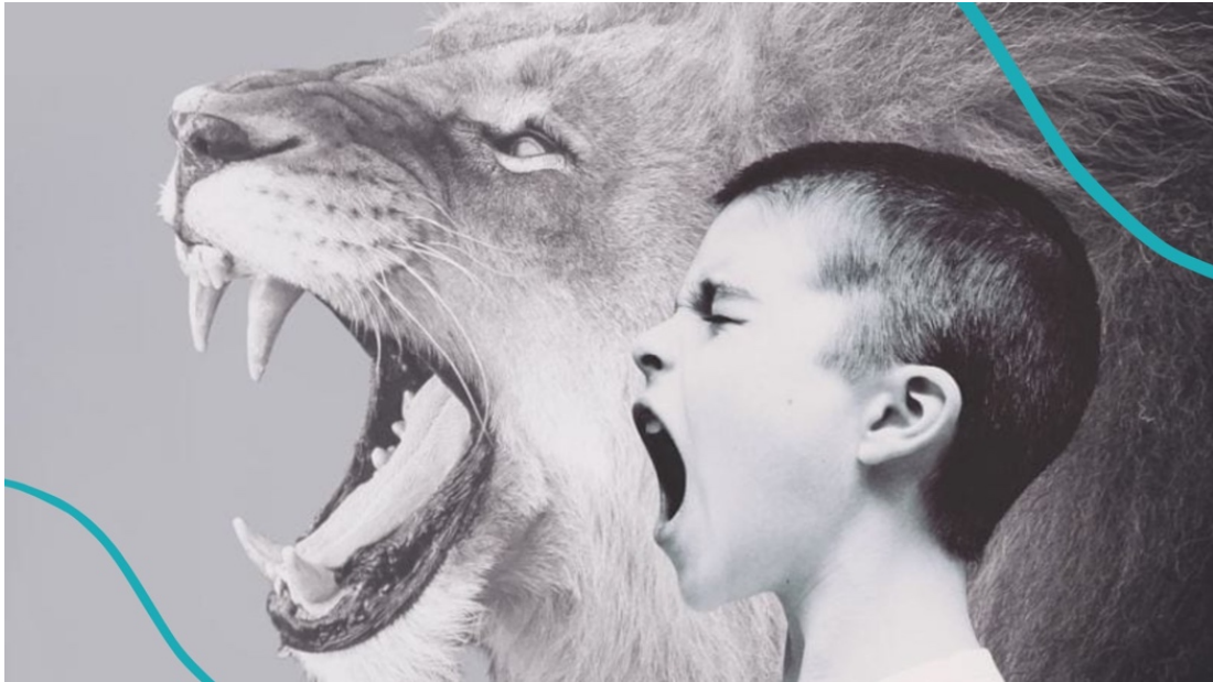
Fotografija broj 12. Lav i miš – maske. 12