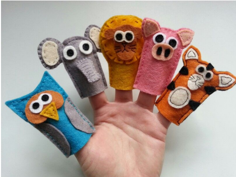
Fotografija broj 6. Prstolutke. 6