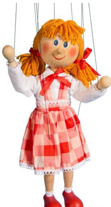
Fotografija broj 7. Marioneta. 7

Ove su lutke obilježile povijest lutkarstva. Korištenjem lutaka potiče se dječje stvaralaštvo i omogućuje slobodno izražavanje kreativnosti. lutka je važna jer neizravno potiče komunikaciju i učenje na zabavan način.