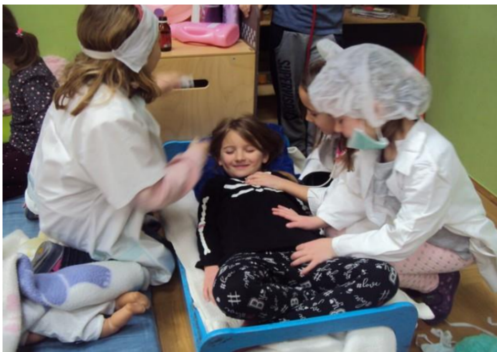
Fotografija broj 9. Igra uloga liječnika i pacijenta. 9