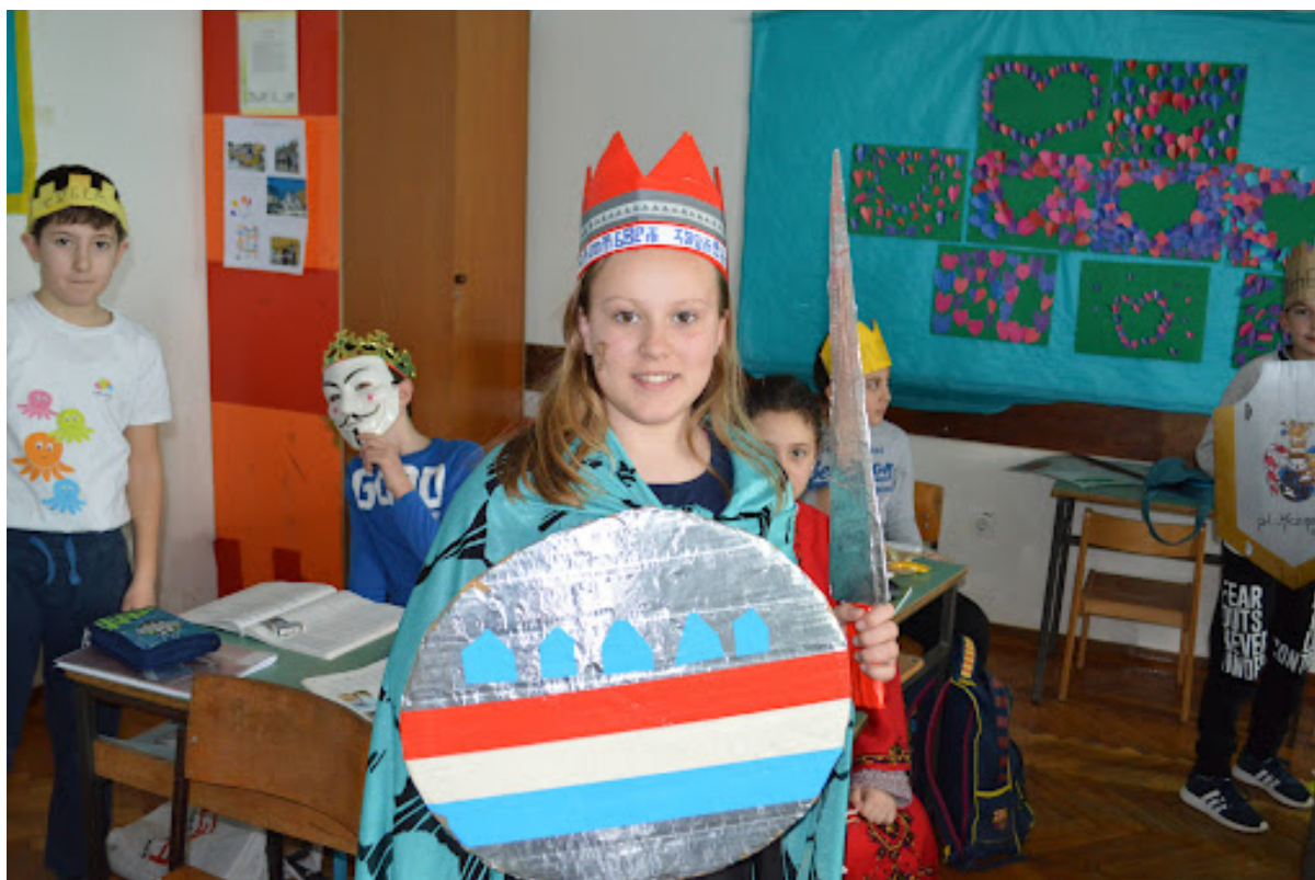
Fotografija broj 10. Putovanje u prošlost. 10