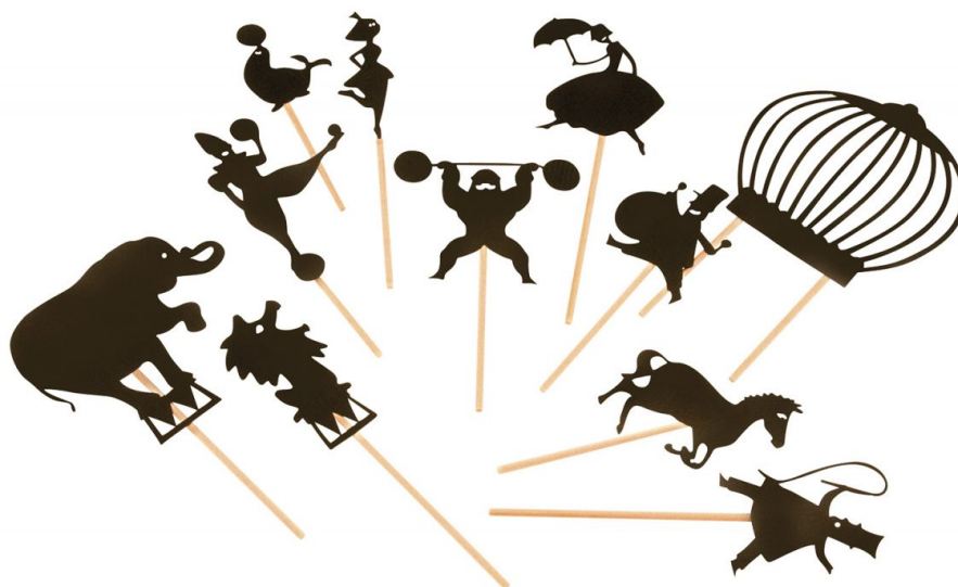
Fotografija broj 3. Lutke sjena. 3