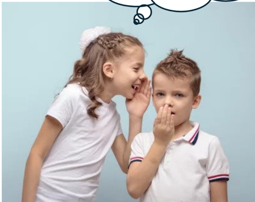
Fotografija broj 13. Različite vrste hoda. 13

Bili kralj i kraljica pa imali jedinca sina.