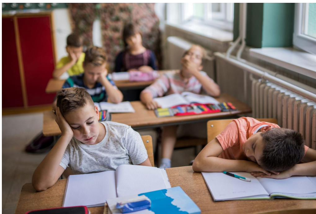
Fotografija broj 11. Jedan dan u životu. 11