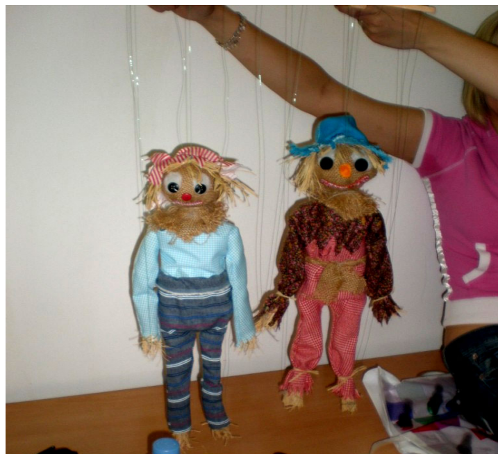
Fotografija broj 8. Lutke u razrednoj nastavi. 8

MARICA: Dostaaaa, dostaaaa!!! Ja to ne mogu više gledati.