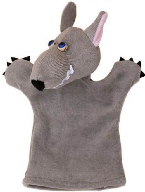
Fotografija broj 4. Ginjol lutke. 4