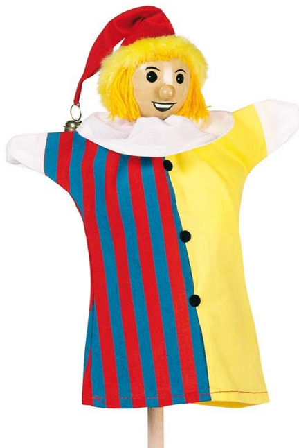
Fotografija broj 2. Javajka. 2