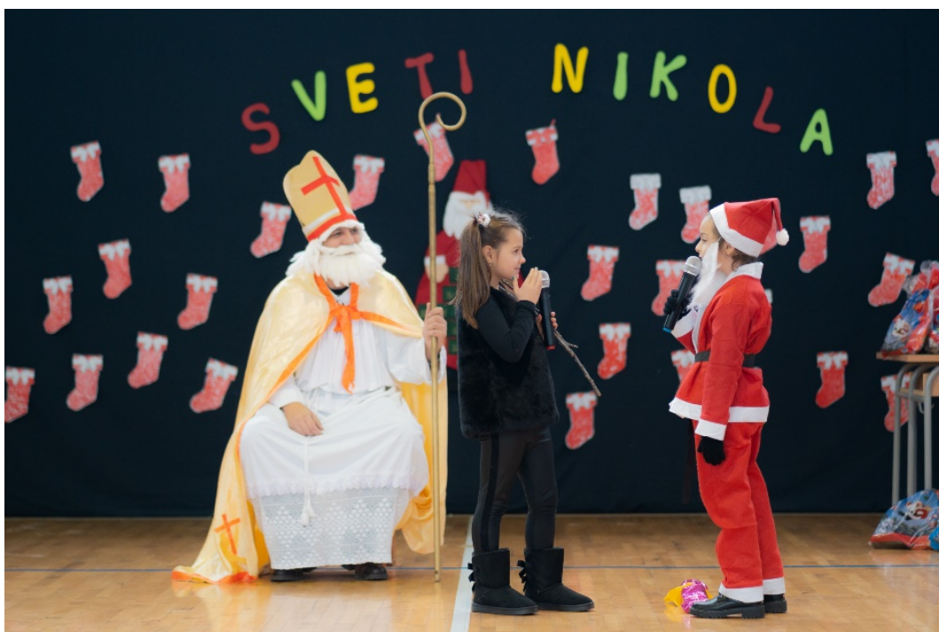
Fotografija broj 1. Igrokaz. 1

Pozadina se bijeli – padaju pahulje. Na končićima visi vata u obliku pahuljica, a posložene su vreće prekrivene velikom bijelom plahtom. Vlada zimski ugođaj. Svira glazba. Ples pahuljica. Na scenu izlaze djeca i grudaju se. To je samo jedan od mogućih izgleda pozornice (Fotografija br. 1.) i uvoda u priču. Učenicima se daje sloboda istraživanja i pronalaska najboljega načina na koji će prikazati scenu.