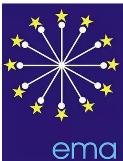
Slika 4. Europska Mažoret Asocijacija (EMA)

Prema Šćurić (2017) 15. siječnja 1999. godine osnovana je EMA - European majorettes' association (Europska mažoret asocijacija). To je udruga tradicionalnih europskih mažoretkinja koja je osnovana u Zagrebu i gdje su se sastali predstavnici deset zemalja Europe (Hrvatska, Bosna i Hercegovina, Slovenija, Italija, Njemačka, Češka, Mađarska, Poljska, Slovačka i Velika Britanija). Kao prvi predsjednik EMA-a izabran je Alen Šćurić (Hrvatska), a kao glavni tajnik izabran je Emil Culinka (Slovačka). Danas Europska mažoret asocijacija broji 12 zemalja članica s više od 50 000 mažoretkinja. Na Europsko prvenstvo plasira se sedam najbolje rangiranih kadetskih, juniorskih i seniorskih sastava, te neformacije (solo i duo) s državnih prvenstava (Šćurić, 2017).