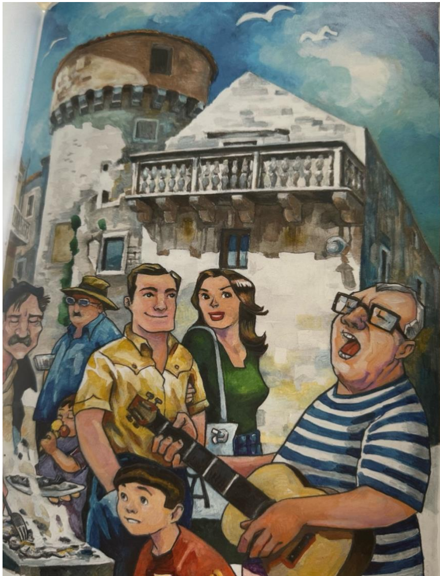
Slika 3: Ilustracija iz slikovnice "Kambelovsaka ljubavna priča - Mihovil Cambi i njegova Karmela" autora Maria Klaića

U nastavku slikovnice nalazi se kratka povijest Kaštel Kambelovca, rječnik i tumač manje poznatih riječi te priča o Svetom Mihovilu – zaštitniku Kaštel Kambelovca.