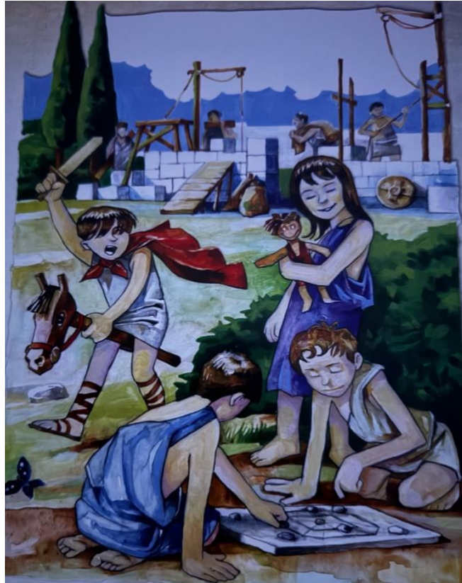
Slika 2: Ilustracija iz slikovnice "Priča o Gaju Liberiju" autora Ibrahima Agačevića