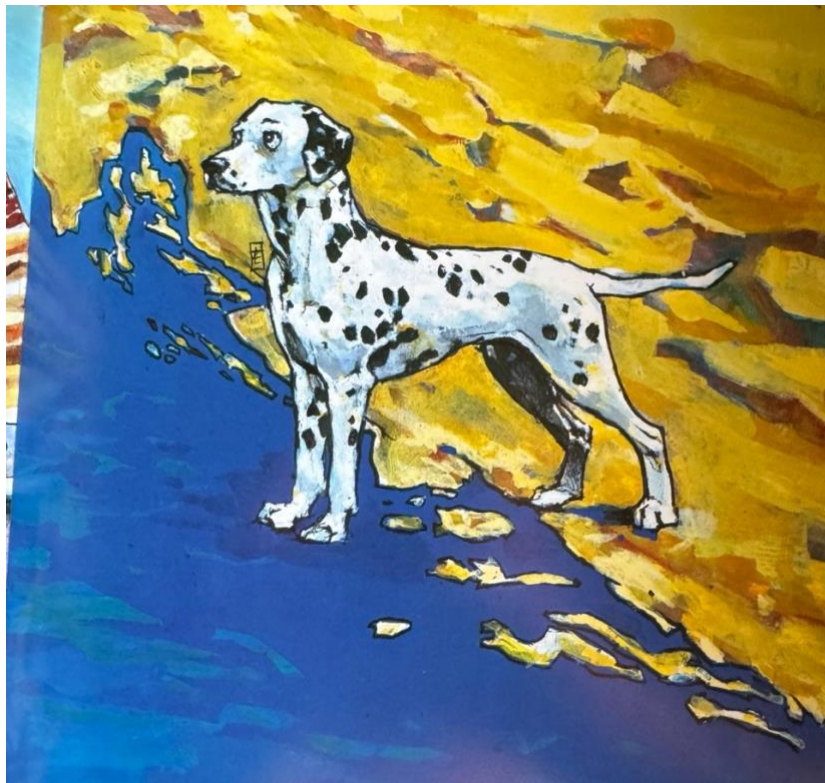
Slika 4: Ilustracija iz slikovnice "Priča o dalmatinskom psu" autora Bože Ujevića

Moje mišljenje o tome je da su te vrste slikovnica zaista neiskorištene. Imaju mnogo prednosti za razvoj djeteta, prvenstveno što jačaju identitet i osjećaj da ono stvarno pripada tom gradu ili zavičaju u kojem se odvija radnja. Osim toga, izvrsna su prilika za učenje i nadograđivanje znanja. Moji kolege autori zaista na zanimljiv način, koji je ujedno blizak djeci nastoje približiti važnost kulturne baštine, koja je u Republici Hrvatskoj uistinu rasprostranjena. Slikovnice i priče su pak dio koji je najbliži djetetu i nešto s čime se ono može poistovjetiti, stoga je moj odgovor da, smatram da može, ali je važno poticati veći broj djece na uključivanje i čitanje.