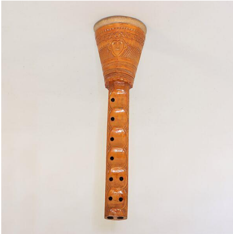
Slika 1. Diple

Gusle (Slika 2.) su kordofono glazbalo. Na guslama se ton dobiva povlačenjem gudala preko nategnute žice, a sastoje se od zvučnoga tijela, vrata i glave. Izrađuju se uglavnom od javorova drveta, osobito onoga koje raste u kršu, jer je ono tvrde, gušće, trajnije. Preko korita (zvučnoga dijela) razapeta je koža, obično jareća, ovčja ili pak zečja. Struna gudala je od dlaka konjskoga repa, kao i struna koja ide preko kobilice. Guslar dok gusli ne smije imati na sebi dlakavo tkanje, niti u njegovoj blizini smije biti vunene odjeće, jer su slab vodič zvuka pa gusle slabo odjekuju (Boras, 1986).