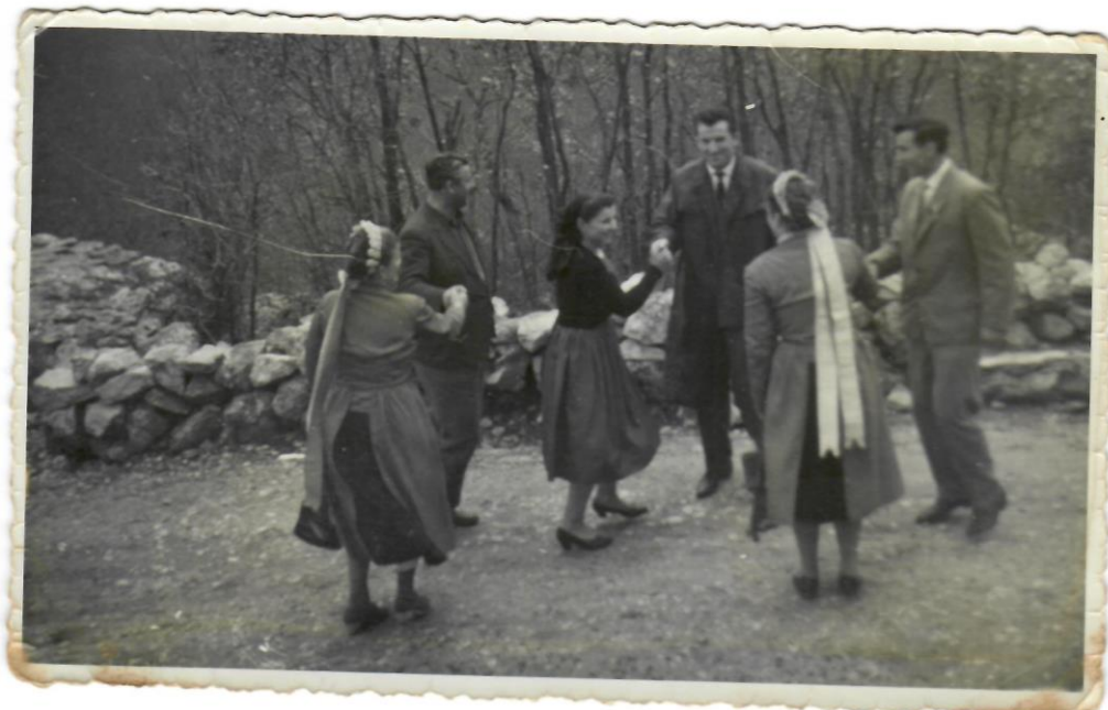
Slika 7. Nevjesta igra kolo s jengama