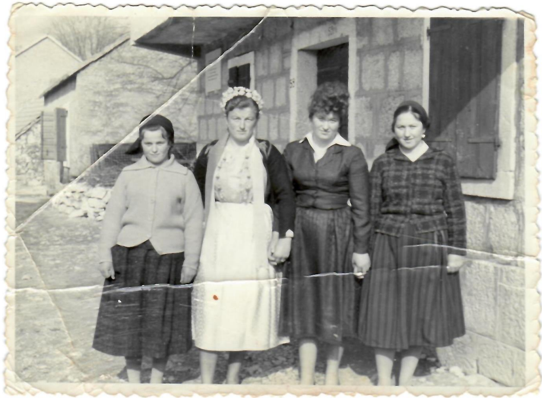
Slika 6. Nevjesta i pirničarke