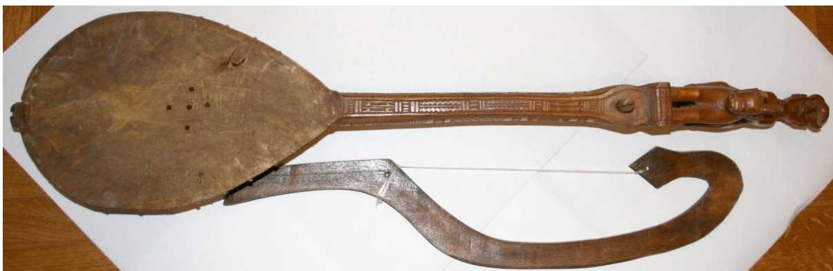
Slika 2. Gusle

Gusle (Slika 2.) su kordofono glazbalo. Na guslama se ton dobiva povlačenjem gudala preko nategnute žice, a sastoje se od zvučnoga tijela, vrata i glave. Izrađuju se uglavnom od javorova drveta, osobito onoga koje raste u kršu, jer je ono tvrde, gušće, trajnije. Preko korita (zvučnoga dijela) razapeta je koža, obično jareća, ovčja ili pak zečja. Struna gudala je od dlaka konjskoga repa, kao i struna koja ide preko kobilice. Guslar dok gusli ne smije imati na sebi dlakavo tkanje, niti u njegovoj blizini smije biti vunene odjeće, jer su slab vodič zvuka pa gusle slabo odjekuju (Boras, 1986).