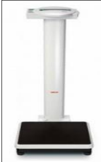
Slika 1. Digitalna stupna vaga