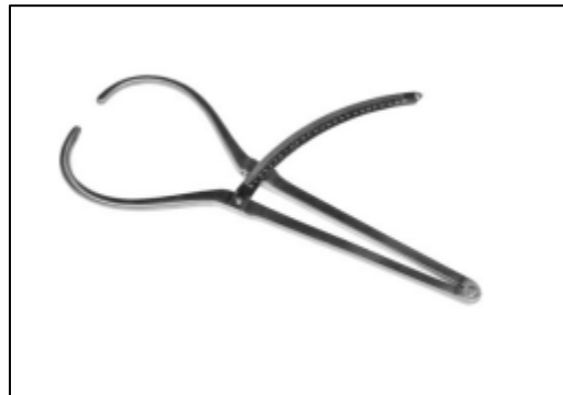
Slika 4. Kefalometar

Konstruiran po principu kao i pelvimetar, kefalometar je instrument namijenjen mjerenju manjih dimenzija. Obično se koristi za određivanje mjera kao što su duljina i širina glave. Ljestvica na kefalometru ima raspon od 30 centimetara i fino je kalibrirana na 0,1 centimetar (Mišigoj-Duraković, 2008). Kefalometar je prikazan na slici 4.