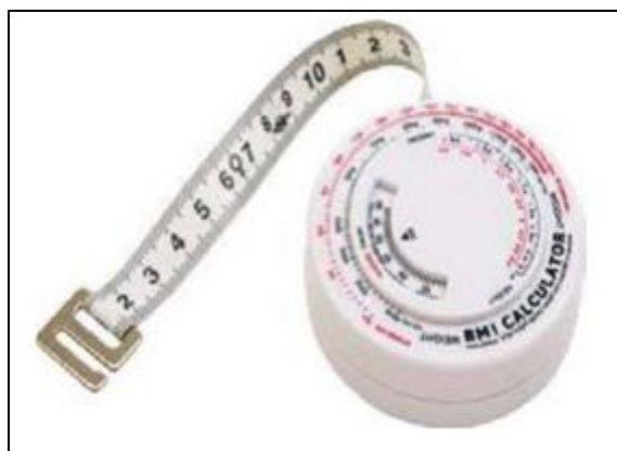
Slika 7. Centimetarska vrpca

Za mjerenje različitih opsega poput opsega glave ili prsnog koša koristi se isključivo centimetarska vrpca. Idealno se predlaže metalna centimetarska vrpca, iako u tu svrhu može poslužiti i plastificirana traka. Duljina vrpce iznosi 150 ili 200 centimetara, a kalibrirana je na preciznost od 0,1 centimetara. Prilikom mjerenja dobivene vrijednosti zaokružuju se na najbližih 0,5 centimetara (Matijašić, 2019). Centimetarska vrpca je prikazana na slici 7.