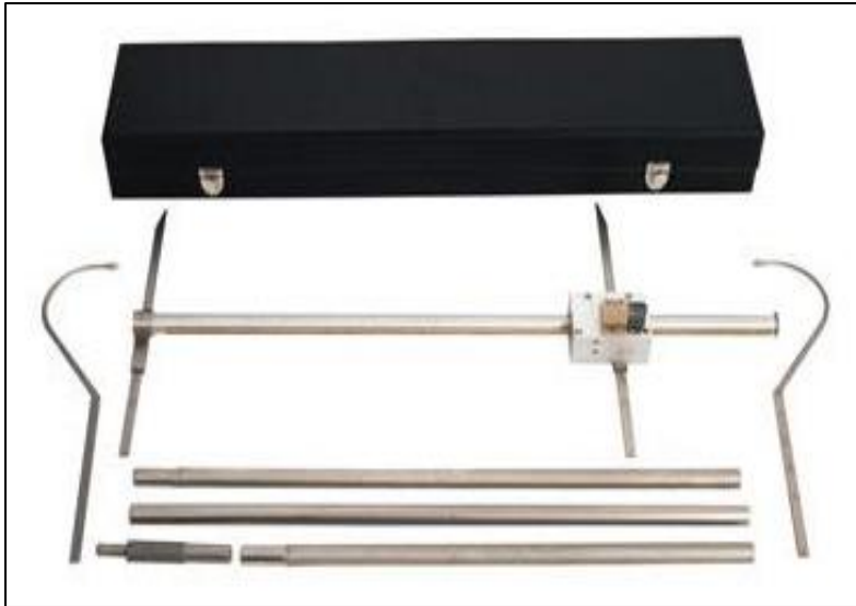
Slika 2. Antropometar