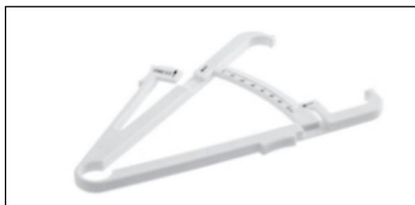
Slika 6. Kaliper

Kaliperom se, pak, mjere kožni nabori. Postoje različite vrste kalipera, uključujući kaliper „škare“ koja vrši pritisak od 20 \text{ g/mm}^2 na kožne duplikature. Njegovi krakovi imaju okrugle krajeve promjera šest milimetara. Mjerna skala obuhvaća 60 milimetara i kalibrirana je na jedan milimetar, no interpolacijom se mjere mogu očitati do 0,5 milimetara. Druga je opcija moderno dizajnirani Bestov kaliper koji ima mjernu skalu od 80 milimetara kalibriranu na jedan milimetar, ali također dopušta očitavanje na 0,5 milimetara. Za složenija mjerenja koristi se Harpendenov kaliper. Primjenjuje pritisak od 10 \text{ g/mm}^2 na duplikature kože i ima pravokutne krajeve krakova dimenzija 15 \times 5 milimetara. Njegova mjerna skala pokriva raspon od 60 milimetara, podijeljen na dijelove od 20 milimetara. Koristi se i Langov kaliper koji je projektiran tako da ima kalibraciju od 0,2 milimetara, ali korištenjem interpolacije postaje moguće točno očitati mjerenja s preciznošću od 0,1 milimetara. Pritisak koji se primjenjuje na duplikator kože iznosi točno 10 \text{ g/mm}^2 , što osigurava dosljedne i pouzdane rezultate. Mjerna skala obuhvaća raspon od 60 milimetara, s fiksnim korakom od jednog milimetra, ali kroz interpolaciju omogućuje očitavanja s finijom rezolucijom od 0,5 milimetara (Mišigoj-Duraković, 2008). Kaliper je prikazan na slici 6.