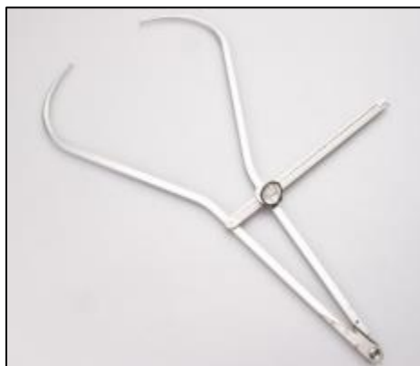
Slika 3. Pelvimetar I.

Pelvimetar je specijalizirani alat koji se koristi za mjerenje različitih poprečnih dimenzija. Pritom se razlikuju dvije vrste: pelvimetar I i pelvimetar II. Na vodoravnoj prečki pelvimetra I nalazi se skala u milimetrima koja povezuje dva kraka. Raspon te skale je 60 centimetara, a instrument je kalibriran na 0,1 centimetara. Ta se skala koristi za mjerenje nekih transverzalnih dimenzija, kao što su širina ramena i karlice. Krakovi pelvimetra obično imaju oštrije završetke koji trebaju pokrivati prethodno označene antropometrijske točke. Da bi se očitala mjerna dužina koristi se linija unutarnjeg ruba klizne prečkice (Kralj, 2018). Pelvimetar je prikazan na slici 3.