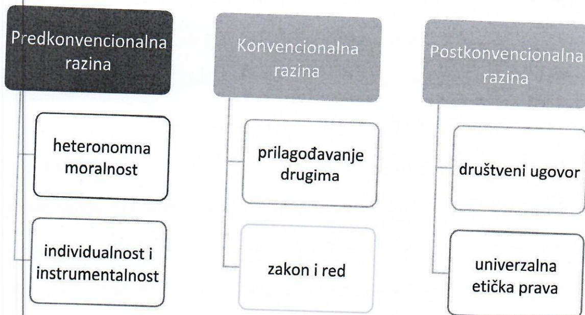
Tablica 2. Razine moralnog razvoja prema Kohlbergu (Garz, 2009)

Čimbenici koji utječu na moralno razumijevanje bili su jednaki kod Piageta i Kohlberga, a ti čimbenici uključuju suočavanje s moralnim pitanjima, nedostatak trenutnog razmišljanja te sposobnost zauzimanja stava kod rješavanja moralnih dilema na naprednije načine. Međutim, Kohlbergova teorija ističe da pojedinci prolaze kroz faze moralnog razvoja te da se moralno rasuđivanje razvija kroz iskustva, razmišljanje i interakciju s društvom. Koristeći navedeni postupak Kohlberg je identificirao tri različite razine moralne zrelosti: predkonvencionalnu razinu, konvencionalnu razinu i postkonvencionalnu razinu.