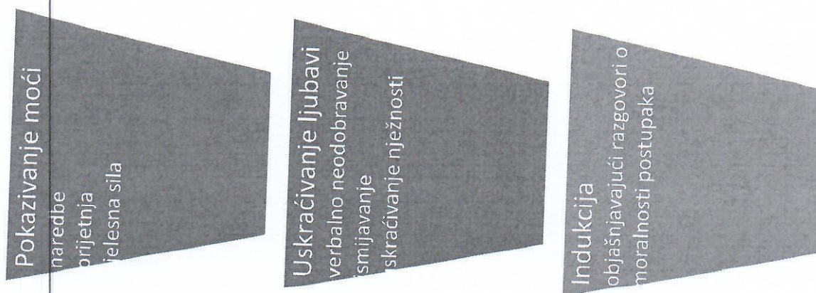
Tablica 3: Odgojni postupci (Berk 2008)

Prema Berku (2008) istraživanja pokazuju kako je najučinkovitiji način koji roditelji primjenjuju je postupak indukcije, jer takva djeca postižu najveću razinu moralnog rasuđivanja u odnosu na prva dva postupka. Kod ovog postupka roditelj daje objašnjenje djeci i na taj način se stvaraju standardi na relaciji dobro-loše te se razvija sposobnost za moralno rasuđivanje.