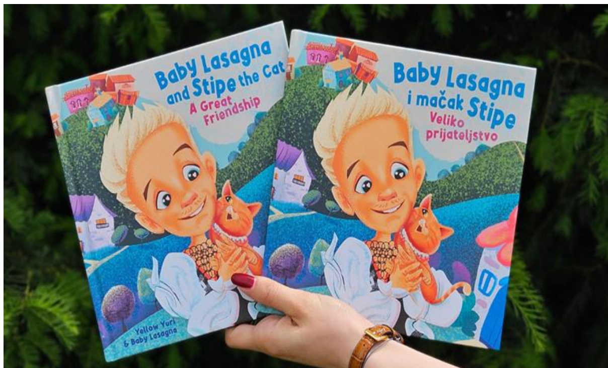
Slika 8.: Trenutno najtraženija slikovnica Beby Lasagna i mačak Stipe u prodaji je nakon finala 15

Jasna je poruka ovoga događaja da slikovnica kao takva i u suvremenom društvu i te kako ima svoje mjesto i ulogu. Naravno, slikovnice nisu samo za malu djecu već i odrasle. Svaka slikovnica osim onih svojih pozitivnih i odgojnih poruka za djecu može i sadržati univerzalne poruke za odrasle kao što je prijateljstvo, požrtvovnost, ustrajnost, jednom riječju dobrota, biti dobar bez obzira na dob i stas!