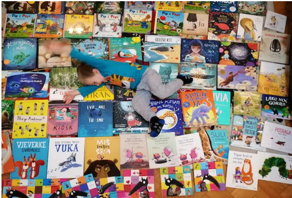
Slika 4.: Prikaz nekih od suvremenih hrvatskih slikovnica 5