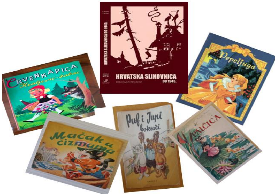
Slika 2.: Neke od slikovnica iz doba naše prošlosti, dostupno na mrežnoj adresi 3