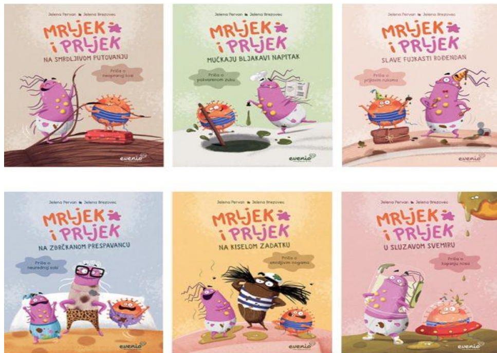
Slika 6.: Primjeri problemskih slikovnica 13