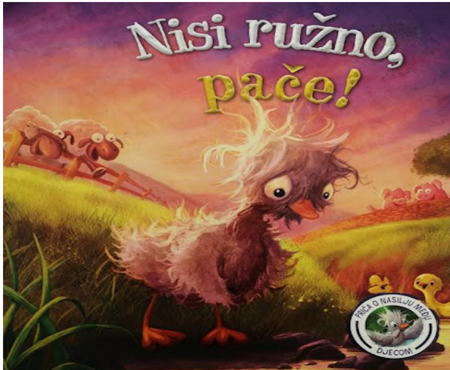
Slika 1.: Naslovna stranica slikovnice 'Nisi ružno, pače!'; u kontekstu nenasilja nad djecom 2