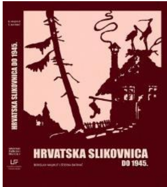
Slika 3.: Naslovna stranica knjige: Hrvatska slikovnica do 1945. / Berislav Majhut i Štefka Batinić. 4