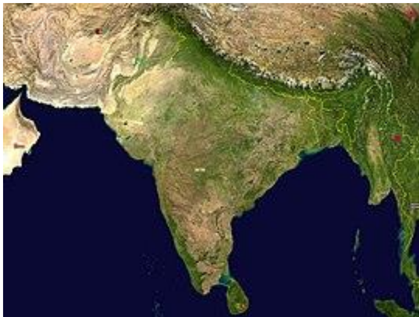
Slika 1. Zemljopisni prikaz Indije 38

Darežljiva priroda pružala je obilje hrane i čovjek je bio oslobođen napora i borbe za opstanak. Indijci nisu nikad osjetili da je svijet bojno polje na kome se ljudi bore za moć, vlasti bogatstvo. Kad ne moramo rasipati svoje snage na rješavanje problema života na zemlji, na iskorištavanje prirode i podčinjavanje sila svijeta, mi počinjemo misliti o višem životu: kako živjeti savršenije u duhu. Možda je topla klima uputila Indiju miru i povučenosti. Ogromne šume sa svojim lisnatim širokim prilazima pružale su mogućnosti pobožnoj duši da mirno šetanjima, sanja čudne snove ili se izlijeva u veselim pjesmama. Ljudi umorni od života idu raspoloženi u prirodu, postižu unutarnji mir slušajući vjetar, pjesmu ptica i šum lišća te se vraćaju s punim srcem i svježim duhom. 37