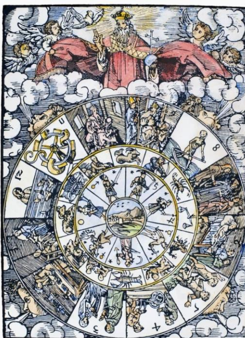
Slika 3. L. Reynmann, Kalendar rođenja , 1515, gravura E. Schon 107

Popni se, ako ti se sviđa, ali po tome zakonu, da ne smatraš nepravdom kada račun moje igračke zatraži da siđeš! 106