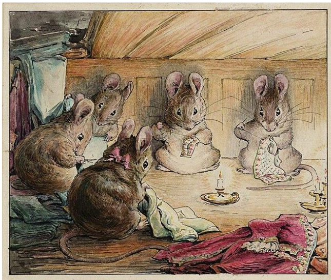
Slika 2. Smeđi miševi dovršavaju Krojačev posao

Potter je taj posao u svojoj priči prepustila smeđim miševima (Slika 2) i ojačala asocijaciju na bajku braće Grimm tako što je događaj smjestila u predbožićno vrijeme.