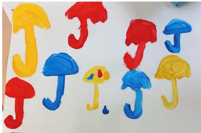
Slika 7: kišobrani (7 godina)

U likovnom radu djeteta od 7 godina primjećujemo razvijen osjećaj za kontrast boje prema boji. Kontrast je ostvaren jer su korištene najmanje 3 različite čiste boje. U ovom radu su korištene primarne boje, a to su plava, žuta i crvena. Raspoređene su ravnomjerno po cijelom radu, stvarajući uravnoteženu i harmoničnu kompoziciju. Ponavljanje oblika kišobrana u različitim bojama stvara osjećaj ritma i harmonije unutar slike. Tekstura je glatka i linije su pravilne. Boja je nanošena ravnomjerno i oblici su pravilni.