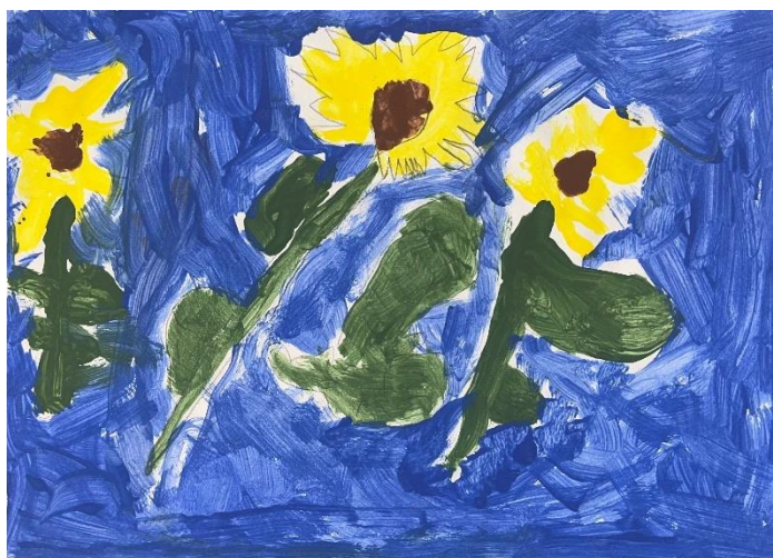
Slika 8: suncokreti (7 godina)

U likovnom radu djeteta od 7 godina primjećujemo razvijen osjećaj za toplo hladni kontrast. Rad koristi dominantno plavu boju za pozadinu, što je hladna boja, i žutu boju za cvjetove, što je topla boja. Omjer korištenih boja i smještaj oblika na pozadinu dodatno pojačava i dočarava kontrast. Žuti suncokreti se ističu na plavoj pozadini što stvara jak kontrast. Plava pozadina zauzima veći dio rada, dok su žuti suncokreti smješteni u središnjem dijelu. Ovaj raspored stvara uravnoteženu kompoziciju koja fokus stavlja na središnji motiv. Tekstura je na dijelovima glatka, a na dijelovima grublja. Linije su slobodne i ima ih u svim smjerovima.