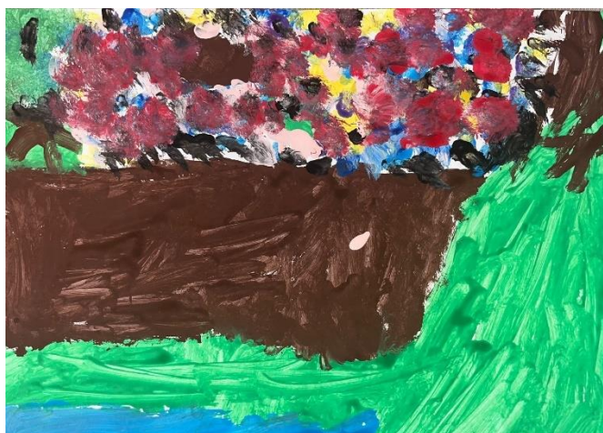
Slika 6: zagađeni potok (6,10 godina)

U likovnom radu djeteta od 7 godina primjećujemo djelomično razvijen osjećaj za toplo hladni kontrast. U ovom radu dominiraju tople boje poput narančaste i smeđe, te hladne boje poput ljubičaste i zelene. Kombinacija toplih i hladnih boja stvara kontrast, ali zbog omjera istih kontrast nije toliko izražajan, pa možemo reći da dijete ima djelomično razvijen osjećaj za toplo hladni kontrast. Pozadina je obojena toplom narančastom bojom. Ljubičasti i zeleni elementi cvijeta stvaraju hladan kontrast u odnosu na toplu pozadinu. Boja nije svugdje nanesena ravnomjerno, a linije su različite jer imamo regularnih i neregularnih. Tekstura je gruba, postignuta kraćim potezima kista i gustim nanosima boje na pojedinim dijelovima. U razvojnom smislu je rad dobar i prati dob djeteta.