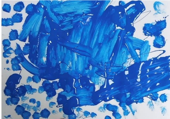
Slika 1: kišobrani (3,11 godina)

U likovnom radu djeteta od 3 godine i 11 mjeseci nije uočeno prepoznavanje kontrasta boje prema boji. Da bi se ostvario kontrast boje prema boji potrebno je koristiti najmanje 3 različite čiste boje. Od boja je korištena isključivo plava boja različitih intenziteta, te s toga smatram da ovo dijete ima nedovoljno razvijen osjećaj za kontrast boje prema boji. Motiv su bili kišobrani, međutim na ovom radu motiv nije prepoznatljiv. Ovaj rad u razvojnom smislu ne prati dob djeteta i interpretacija nije u skladu s dobi djeteta. Kompozicija je zadovoljavajuća, dinamična, s ispunjenim središnjim dijelom, dok su krajevi prazniji. Tekstura nije svugdje jednaka jer u središnjem dijelu imamo guste nanose boje, a u krajevima raspršene kapljice boje.