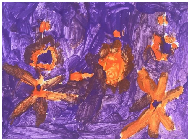
Slika 2: suncokreti (6,5 godina)

U likovnom radu djeteta od 6 godina i 5 mjeseci primjećujemo nedovoljno razvijen osjećaj za toplo hladni kontrast. Iako su korištene tople i hladne boje, primjećujemo miješanje boja što umanjuje intenzitet boje, a samim time i kontrast. Ljubičasta boja korištena je kao pozadina, dok su narančasti oblici smješteni u prvom planu. Topla boja oblika nam daje dojam da se oblici nalaze bliže, dok hladna pozadina stvara dojam udaljenosti. Tekstura pozadine djeluje grubo, ali i dinamično. Boja je nanošena gusto i neravnomjerno, kraćim potezima kista. Kompozicija je dinamična i oblici su raspoređeni u središnjem dijelu.