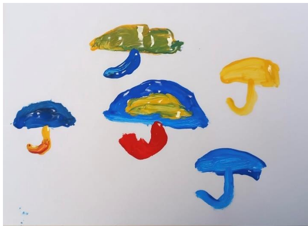
Slika 4: kišobrani (6,9 godina)

U likovnom radu djeteta od 6 godina i 9 mjeseci primjećujemo djelomično razvijen osjećaj za kontrast boje prema boji. Korištene su 3 čiste boje što je potrebno da bi se kontrast ostvario, ali u određenim dijelovima ima miješanja boja što umanjuje kontrast. Dijete je u radu koristilo primarne boje, a to su plava, žuta i crvena. Boje su raspoređene ravnomjerno po slici i time stvaraju uravnoteženu kompoziciju. Ponavljanje oblika u različitim bojama stvara osjećaj ritma i harmonije unutar slike. Linije koje se pojavljuju na ovom radu su pravilne, ravne i zakrivljene. Tekstura je glatka i boja je nanošena ravnomjerno preciznim pokretima kista.