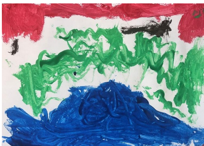
Slika 3: zagađeni potok (3,5 godina)

U likovnom radu djeteta od 6 godina i 5 mjeseci primjećujemo nedovoljno razvijen osjećaj za toplo hladni kontrast. Iako su korištene tople i hladne boje, primjećujemo miješanje boja što umanjuje intenzitet boje, a samim time i kontrast. Ljubičasta boja korištena je kao pozadina, dok su narančasti oblici smješteni u prvom planu. Topla boja oblika nam daje dojam da se oblici nalaze bliže, dok hladna pozadina stvara dojam udaljenosti. Tekstura pozadine djeluje grubo, ali i dinamično. Boja je nanošena gusto i neravnomjerno, kraćim potezima kista. Kompozicija je dinamična i oblici su raspoređeni u središnjem dijelu.