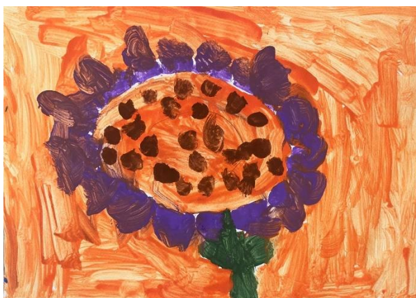
Slika 5: suncokreti (7 godina)

U likovnom radu djeteta od 7 godina primjećujemo djelomično razvijen osjećaj za toplo hladni kontrast. U ovom radu dominiraju tople boje poput narančaste i smeđe, te hladne boje poput ljubičaste i zelene. Kombinacija toplih i hladnih boja stvara kontrast, ali zbog omjera istih kontrast nije toliko izražajan, pa možemo reći da dijete ima djelomično razvijen osjećaj za toplo hladni kontrast. Pozadina je obojena toplom narančastom bojom. Ljubičasti i zeleni elementi cvijeta stvaraju hladan kontrast u odnosu na toplu pozadinu. Boja nije svugdje nanesena ravnomjerno, a linije su različite jer imamo regularnih i neregularnih. Tekstura je gruba, postignuta kraćim potezima kista i gustim nanosima boje na pojedinim dijelovima. U razvojnom smislu je rad dobar i prati dob djeteta.