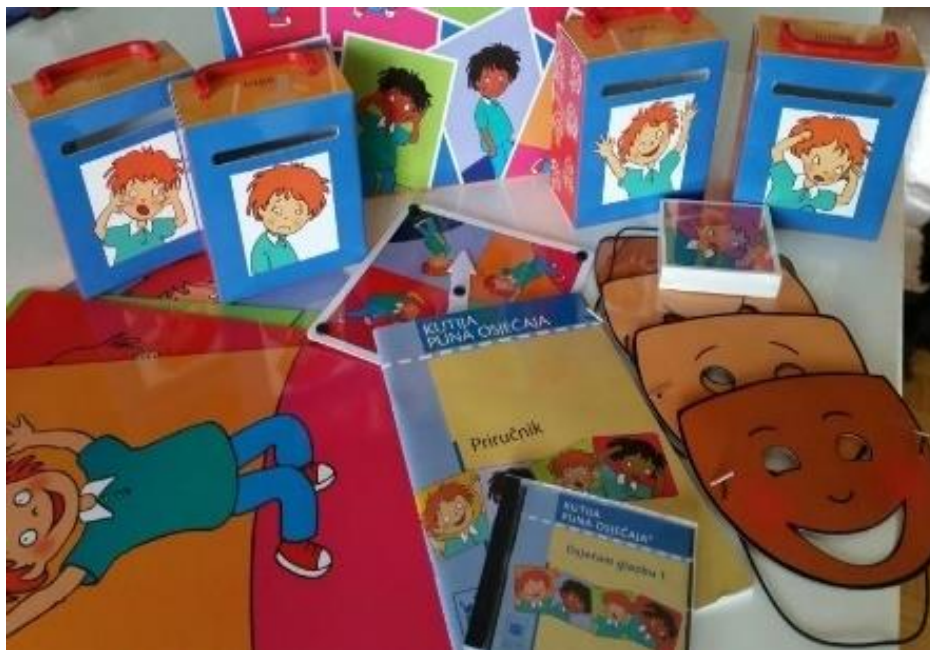
Slika 2. Aktivnosti iz Kutije pune osjećaja

Četvrta aktivnost planirana je za provođenje tri puta tjedno, a odnosi se na aktivnosti iz Kutije pune osjećaja. Aktivnosti koje su planirane su: „zavrti kolo“ i „priča o osjećajima“. Aktivnost „zavrti kolo“ sadrži okruglu podlogu na kojoj su označene četiri osnovne emocije (sreća, tuga, strah i ljutnja), a na podlozi je zakačena vrtilica. Planirano je da u aktivnosti sudjeluje odgojiteljica te da dijete zavrti vrtalicu koja će se zaustaviti na određenoj emociji, a dijete treba ispričati situaciju u kojoj se ono ili netko drugi tako osjećao. Nadalje, aktivnost „priča o osjećajima“ sadrži četiri kutije s prorezom na kojima je prikazana po jedna osnovna emocija (Slika 2.) te 40 kartica. Na svakoj kartici na prednjoj strani prikazana je slika određene situacije, a na poleđini je napisana anegdota o toj situaciji. Planirano je da djeca sama odluče žele li izmisliti priču prema slici koju vide ili žele da odgojiteljica pročita što piše na poleđini. Cilj igre je razumjeti događaj te procijeniti kako se osjećalo dijete iz anegdote ili izmišljene priče te ubaciti karticu u određenu kutiju.