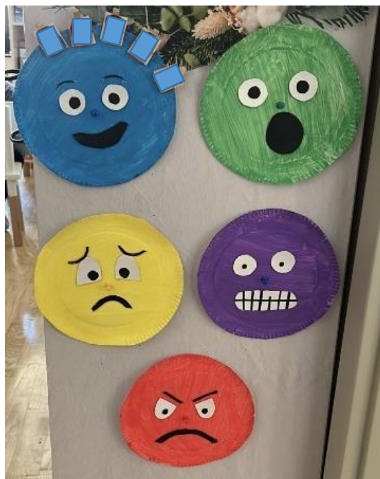
Slika 1. Aktivnost „Kako se danas osjećam?“

Aktivnost „Kako se danas osjećam?“ sadržava pet krugova, a na svakom krugu prikazana je jedna od osnovnih emocija te fotografije djece zakačene na štipaljka (Slika 1). Planirano je da se ova aktivnost provodi svakodnevno i to prije glavnog obroka, kada djeca sjede za stolovima. Zajedno s djecom dogovoreno je i označeno posebno mjesto u sobi gdje će dijete stati kako bi verbaliziralo kako se osjeća te objasnilo uzroke i posljedice te emocije.