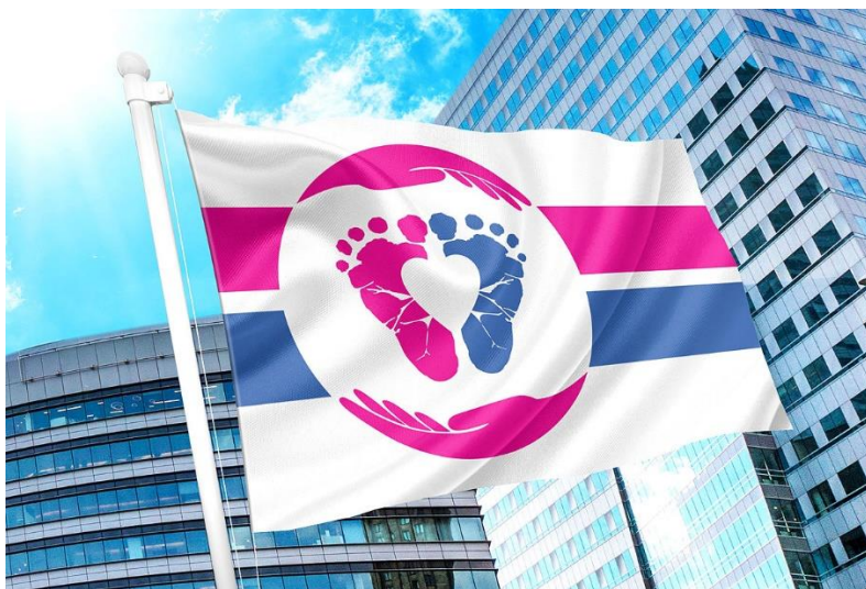
Slika 2. Prikaz službene zastave „Pro-life“ pokreta