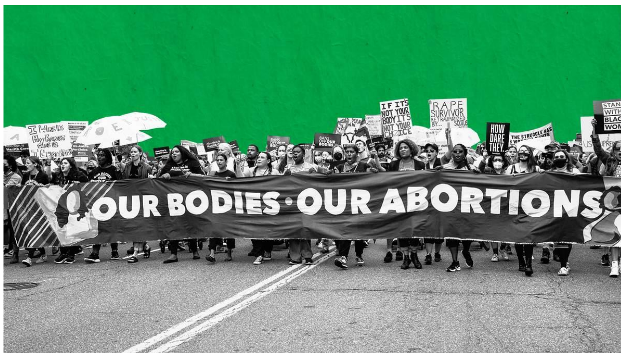
Slika 3. Prikaz pro choice pokreta