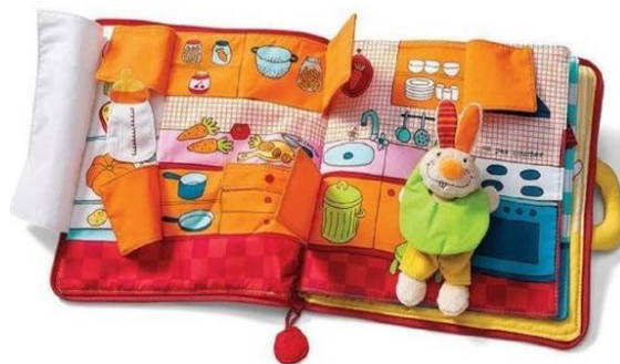
Slika 2. Prikaz interaktivne slikovnice za djecu rane dobi

Kod djece rane dobi iznimno je važna materijalna kvaliteta slikovnice, odnosno da nisu lako potrošne te da ne sadrže otrovne boje zbog oralne faze u kojoj se dijete nalazi (Šišnović, 2021). Što je dijete manje, tekst slikovnice treba biti kraći i jednostavniji, a slova krupnija i jednostavna po obliku (Šišnović, 2011). Ilustracije u toj dobi trebaju biti velike i realne s malo detalja zbog djetetove kraće koncentracije (Pažin i Franolić, 2022) i ograničene percepcije. Nakon djetetove navršene prve godine, poželjno je koristiti interaktivne slikovnice (slikovnice koje sadrže prozorčice, ogledala, oblike) radi djetetova senzornog i motoričkog razvoja (Pažin i Franolić, 2022). „Kako djeca rastu, sve su spremnija za složenije sadržaje, koncentriranija za pomna gledanja i duže pripovijedanje“ (Pažin i Franolić, 2022:62).