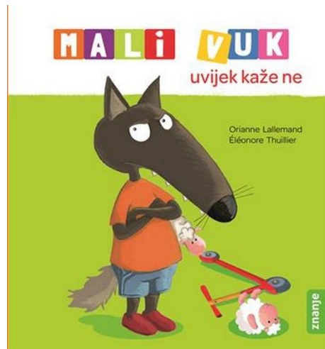
Slika 4. Prikaz slikovnice za svakodnevne situacije s kojima se djeca susreću (dob od 3. do 5. godine)