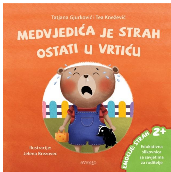
Slika 3. Prikaz edukativne slikovnice o emocijama (dob 2+)

Osim djeteta, pripovjedač također treba imati osjećaj zadovoljstva pripovijedajući priču. Zato je vrlo važno da odabir priče ne bude samo iz razloga da posao pripovijedanja odradi ili zato što ju je neki priručnik savjetovao, „već zato što i sam u njoj uživa, što je voli, poznaje, razumije, što osjeća da se priča upravo njemu obraća“ (Velički, 2013:52). Na takav način djeca će doživjeti sve emocije i uzbuđenje koje i sam pripovjedač proživljava (Otero, 2005). Upravo zbog toga odabir osobnih priča ima najsnažniji utjecaj na dijete. Pričajući priče o sebi i osobnim iskustvima, roditelj ili odgajatelj prenose poruku djetetu da je biti ono što jesi također važno, pogotovo u svijetu priča, punih snažnih junaka, lijepih princeza i mudrih čarobnjaka (West i Sarosy, 2021).