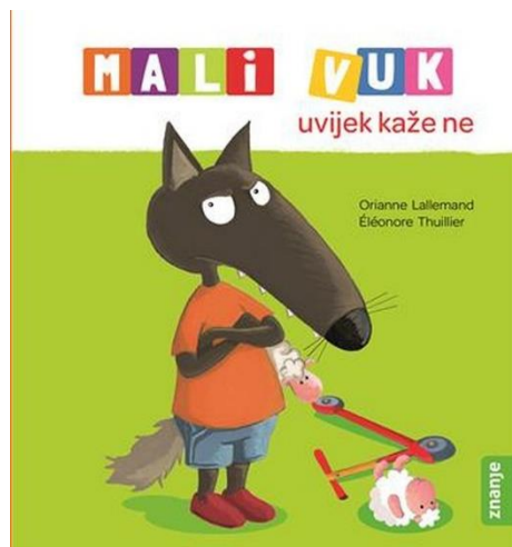
Slika 4. Prikaz slikovnice za svakodnevne situacije s kojima se djeca susreću (dob od 3. do 5. godine)