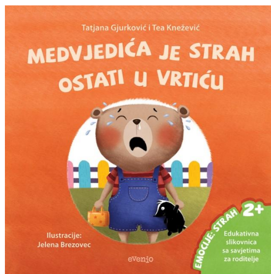
Slika 3. Prikaz edukativne slikovnice o emocijama (dob 2+)

Osim djeteta, pripovjedač također treba imati osjećaj zadovoljstva pripovijedajući priču. Zato je vrlo važno da odabir priče ne bude samo iz razloga da posao pripovijedanja odradi ili zato što ju je neki priručnik savjetovao, „već zato što i sam u njoj uživa, što je voli, poznaje, razumije, što osjeća da se priča upravo njemu obraća“ (Velički, 2013:52). Na takav način djeca će doživjeti sve emocije i uzbuđenje koje i sam pripovjedač proživljava (Otero, 2005). Upravo zbog toga odabir osobnih priča ima najsnažniji utjecaj na dijete. Pričajući priče o sebi i osobnim iskustvima, roditelj ili odgajatelj prenose poruku djetetu da je biti ono što jesi također važno, pogotovo u svijetu priča, punih snažnih junaka, lijepih princeza i mudrih čarobnjaka (West i Sarosy, 2021).