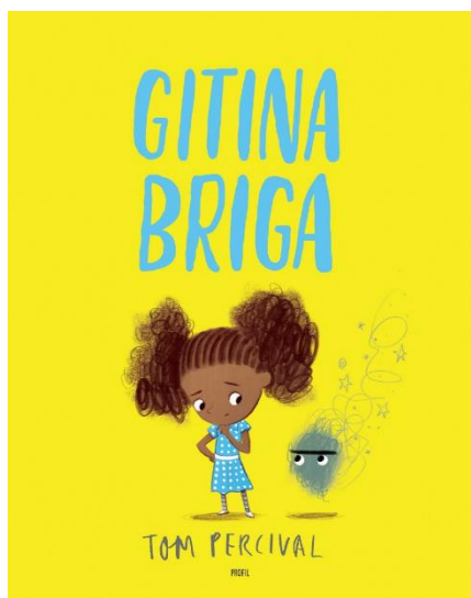
Slika 5. Prikaz slikovnice za ovladavanje teških emocija i izgradnju samopouzdanja (dob 4+)