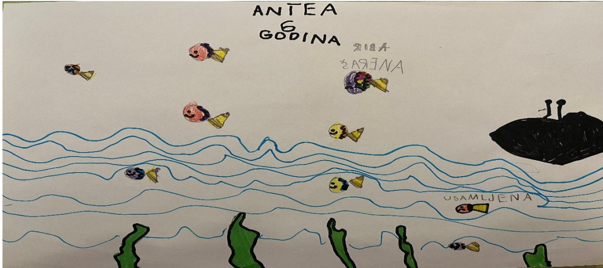
Slika 2, A.R (6 godina)

Likovna tehnika koju dijete koristi je kombinira tehnika flomasteri i drvene boje. Likovi riba su smješteni po cijelom crtežu, čime se stvara osjećaj dinamike i kretanja. S desne strane crteža nalazi se neman, koja se spominje u priči, kao i same ribe. Plave valovite linije koje predstavljaju more ispunjavaju veći dio crteža. Linije korištene za crtanje riba su zatvorene, definirajući njihove oblike. Na crtežu prevladavaju primarne i sekundarne boje. RIBE su obojene raznim bojama, uključujući žutu, ljubičastu i ružičastu što ih čini istaknutima. Plava, koja je primarna boja, dominira donjom polovicom crteža i koristi se za prikaz morskih valova, stvarajući dojam podvodne atmosfere. Zelena, koja je sekundarna boja, prikazuje morsku travu. Crna, koja je neutralna boja, prikazuje predmet (neman) u desnom kutu te stvara kontrast s ostatkom crteža. Dijete je posvetilo pažnju detaljima poput lica riba, koje su prikazane sa smiješkom. Crtež je očito nastao pod velikim utjecajem priče, s obzirom na to da je dijete napisalo i imena riba koje se pojavljuju u priči.