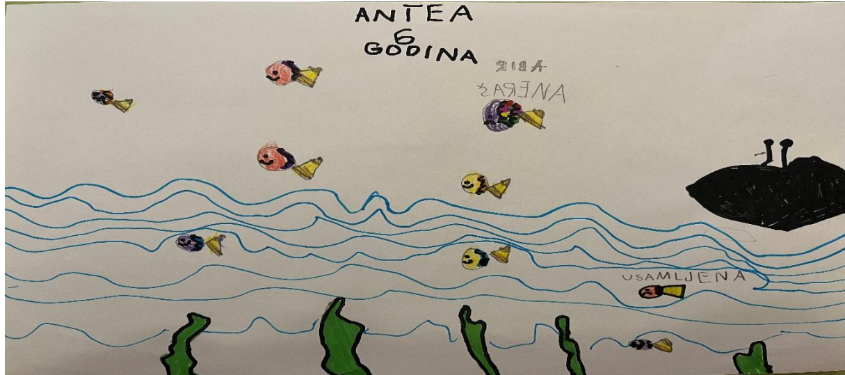
Slika 2, A.R (6 godina)

Likovna tehnika koju dijete koristi je kombinira tehniku flomasteri i drvene boje. Likovi riba su smješteni po cijelom crtežu, čime se stvara osjećaj dinamike i kretanja. S desne strane crteža nalazi se neman, koja se spominje u priči, kao i same ribe. Plave valovite linije koje predstavljaju more ispunjavaju veći dio crteža. Linije korištene za crtanje riba su zatvorene, definirajući njihove oblike. Na crtežu prevladavaju primarne i sekundarne boje. RIBE su obojene raznim bojama, uključujući žutu, ljubičastu i ružičastu što ih čini istaknutima. Plava, koja je primarna boja, dominira donjom polovicom crteža i koristi se za prikaz morskih valova, stvarajući dojam podvodne atmosfere. Zelena, koja je sekundarna boja, prikazuje morsku travu. Crna, koja je neutralna boja, prikazuje predmet (neman) u desnom kutu te stvara kontrast s ostatkom crteža. Dijete je posvetilo pažnju detaljima poput lica riba, koje su prikazane sa smiješkom. Crtež je očito nastao pod velikim utjecajem priče, s obzirom na to da je dijete napisalo i imena riba koje se pojavljuju u priči.