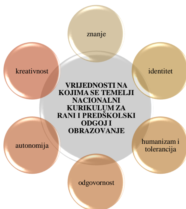
Slika 1. Nacionalni kurikulum za rani i predškolski odgoj i obrazovanje - vrijednosti