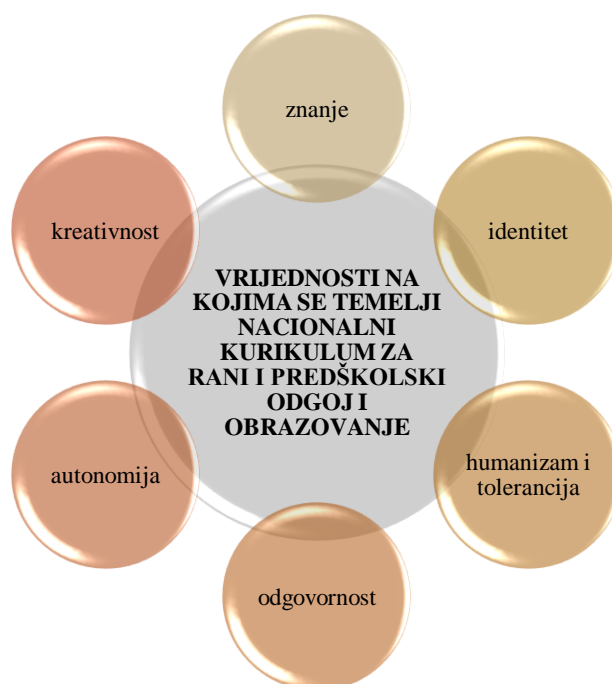
Slika 1. Nacionalni kurikulum za rani i predškolski odgoj i obrazovanje - vrijednosti