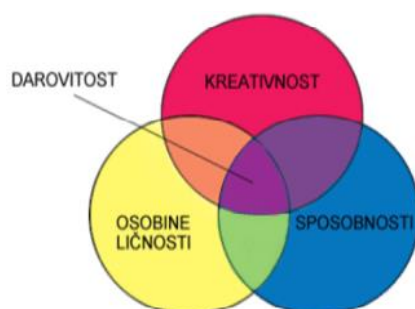
Slika 1 Troprstenasta definicija darovitosti prema Renzulli i Reis (1985.) 1