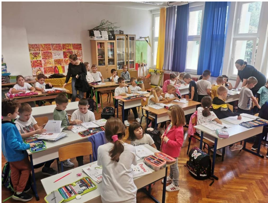
Slika 4.: Suradnja dječjeg vrtića i osnovne škole ( https://www.vrtic-travica.hr/2023/11/16/suradnja-djecjeg-vrtica-i-osnovne-skole-se-nastavlja/ , pristupljeno 13. 8. 2024)