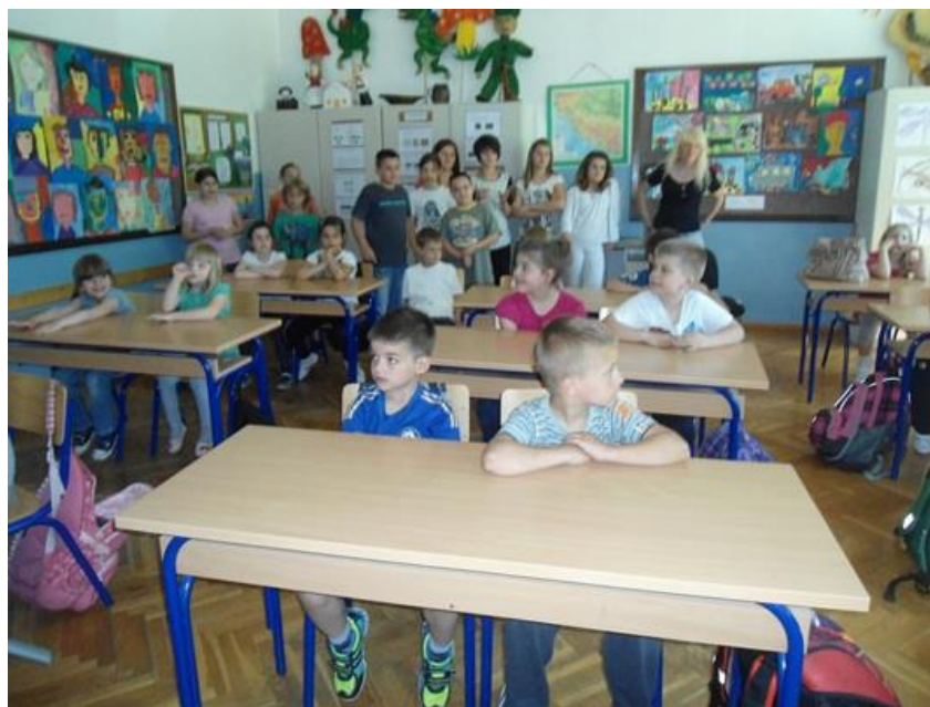
Slika 1. : Posjet predškolske djece u školi ( https://www.dv-zirek.hr/novosti_detaljno.asp?page=58 , pristupljeno 13. 8 . 2024.)