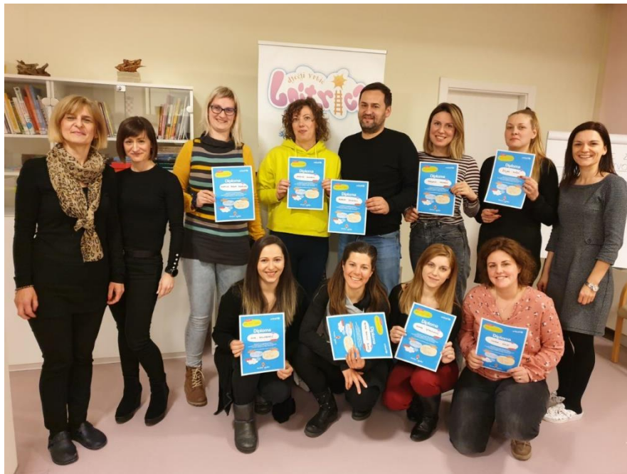
Slika 3.: Edukacije za roditelje (Roditelji koji su završili program „Rastimo zajedno“, https://www.dv-lojtrica.hr/roditelji-završili-program-rastimo-zajedno/ pristupljeno 13. 8 . 2024.)