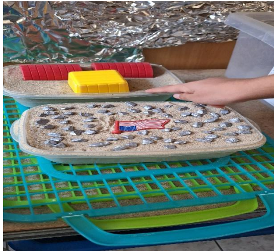
Slika 5. Dijete radi kolač od pijeska

Punjenjem kantica, kalupa ili drugih posuda s pijeskom koji je iznimno natopljen vodom, djeca „peku“ kolače, a kuhanje jela od blata pruža im posebnu ugodu i zabavu (Hansen, Kaufmann i Walsh, 2001).