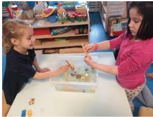
Slika 7. Djeca istražuju topivost materijala u vodi

Za istraživanje topivosti materijala u vodi, djeci je potrebno osigurati različite materijale od kojih su neki topivi, a neki ne (ulje, šećer, mljevena kava, brašno, pijesak, kamenčići, dugmići i slično). Uz materijale, potrebne su i kartice koje sadržavaju uzorke ponuđenih materijala u svrhu bilježenja rezultata istraživanja te deblji papir, ljepilo i škare. Djeca će topivost materijala otkrivati slobodno i postepeno, odnosno na način koji je njima i njihovoj dobi primjeren (Slunjski, 2006).