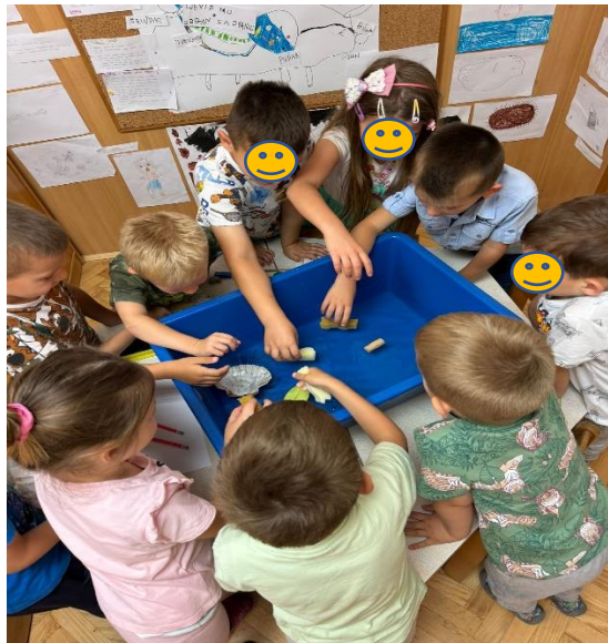
Slika 6. Djeca istražuju plovnost predmeta

Za ovu je aktivnost potrebna velika kutija koja se treba napuniti vodom da bi u nju djeca mogla stavljati različite predmete: kamenje, pluto, spužve, drvca i slično. Ovom aktivnošću pokušavaju doći do zaključka koji od ovih predmeta plutaju, a koji tonu. U konačnici bi zaključili da teški predmetu tonu na dno, a lagani ostaju plutati na površini (Hansen, Kaufmann i Walsh, 2001).