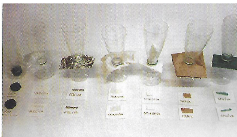
Slika 9. Materijali za istraživanje propusnosti vode

Za ovu su aktivnost potrebne plastične posude, različiti materijali od kojih neki zadržavaju vodu, a neki propuštaju (plastika, aluminijska folija, papir, tkanina i slično) te vrhovi plastičnih boca. Na izlazu svake boce nalazi se određeni materijal ispod kojeg je smještena posuda za vodu te kroz ovu aktivnost djeca zaključuju koji materijali i zbog čega propuštaju vodu, a koji ne (Slunjski, 2006).