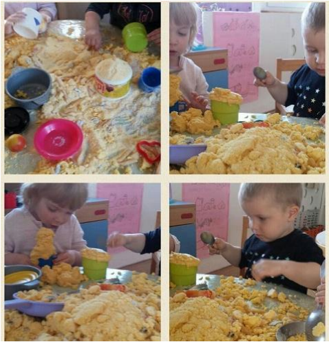
Slika 3. Istraživanje rastresitih materijala