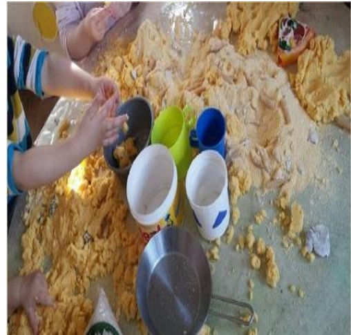
Slika 4. Simbolička igra u centru kuhinje