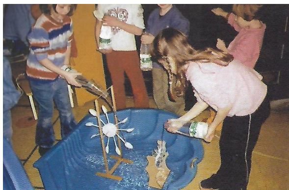
Slika 8. Djeca istražuju pokretanje vodenice