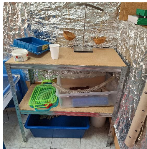
Slika 2. Materijali u centru za igre pijeskom