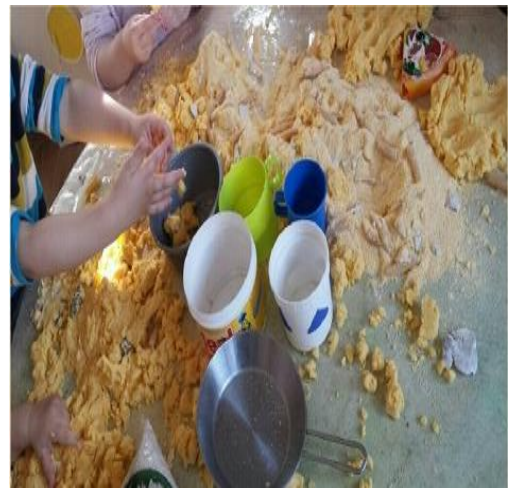
Slika 4. Simbolička igra u centru kuhinje