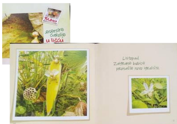
Slika 2: Naslovnica i dio teksta slikovnice „Jesenske čarolije u lišću lotusa“

Slikovnica ima pedagošku vrijednost, tekstom i fotografijom govori djeci o promjenama u prirodi koje se događaju u mjesecu listopadu, a to otvara prostor za integrirano učenje o prirodoslovlju, jeziku, matematici 12 .