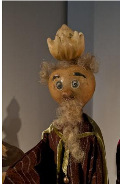
Slika 6: Lutka Tikvan i Kralj 17