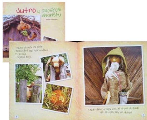
Slika 3: Naslovnica i dio teksta slikovnice „Jutro u seoskom dvorištu“