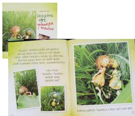
Slika 4: Naslovnica i dio teksta slikovnice „Proljetne igre Travuljka i Travčice“

Slikovnica objavljena također 2017. godine. Tematski ova slikovnica govori o livadi u proljeće kroz koju djecu vode dva lika Travuljak i Travčica. Osim što tekstom na suptilan i nenametljiv način djeci sugerira što se sve na livadi može raditi, slikovnica djecu uči i nazivima samoniklog bilja koje tamo mogu pronaći. Tekst je jednostavan, usložnjavaju ga nazivi biljaka čime se bogati dječji rječnik i otvara mogućnost dodatnog istraživanja biljaka i proširivanja znanja o prirodoslovlju. Ovu slikovnicu možemo svrstati u one koje potiču spoznajni razvoj djece. Putem teksta i ilustracija djeca imaju priliku upoznati život livade, biljaka i životinja što potpomaže učenje i proširivanje znanja slikovnicom 14 .