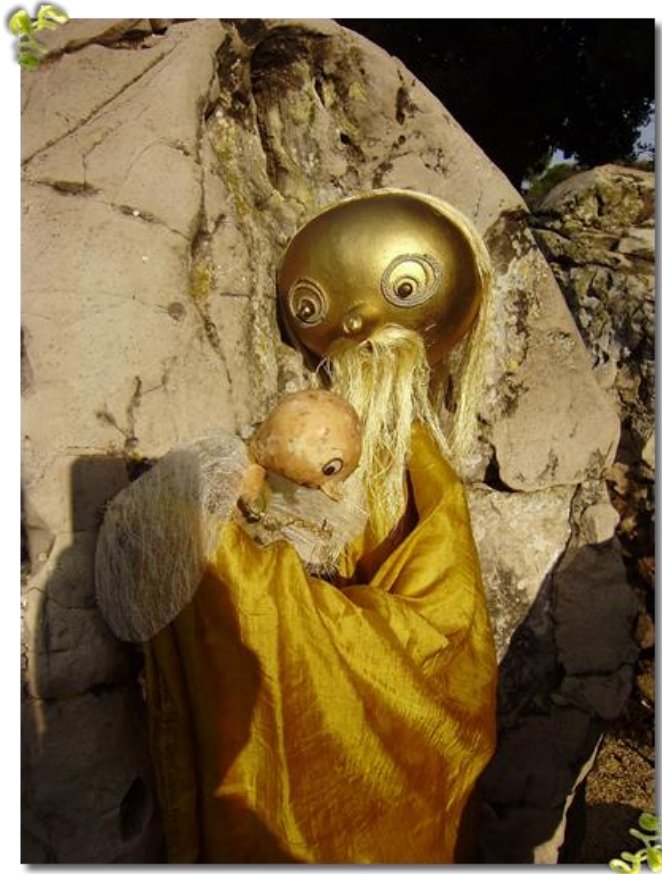
Slika 7: Lutka Mjesec 18

priče Pohodio me Mjesec i Bajka u kući koje su objavljene u časopisu Radost (Pokrivka, 1996: 39).