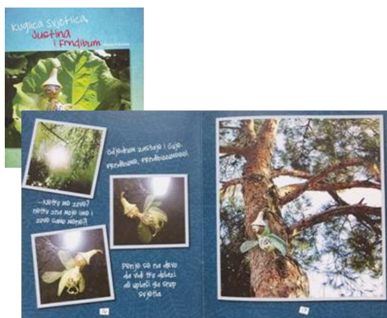
Slika 5: Naslovnica i dio teksta slikovnice „Kuglica Svjetlica, Justina i Frndibum“

U slikovnici se kao lik pojavljuje i lutka Mjesec koja utjelovljuje svjetlost. Ova se slikovnica tematski razlikuje od ostalih iz ciklusa. Njezina je pedagoška vrijednost u poticanju djece na promišljanje o ljudskim vrijednostima i važnosti dobrote. Po tematici bi je mogli svrstati u slikovnice koje potiču razvoj pozitivnih osobina ličnosti i socijalnih vještina.