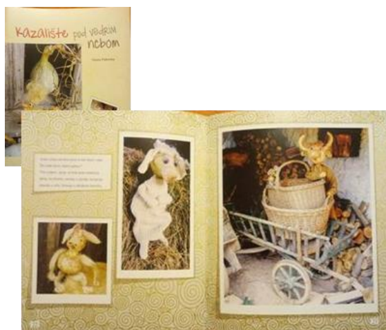
Slika 1: Naslovnica i dio slikovnice „Kazalište pod vedrim nebom“

Slikovnica je objavljena 2015. u sklopu biblioteke „Tikvići“ koja je kasnije objavila i ostale slikovnice iz autorskog niza Vlaste Pokrivke.