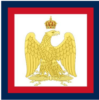
Slika 2. Zastava Rajnske konfederacije