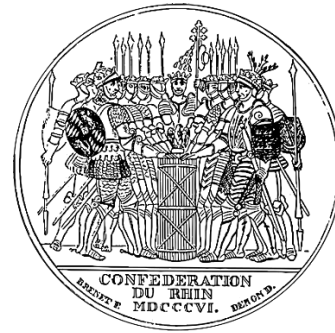
Slika 3. Komemorativna medalja