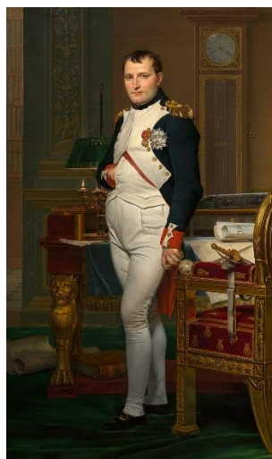
Slika 4. Napoleon Bonaparte