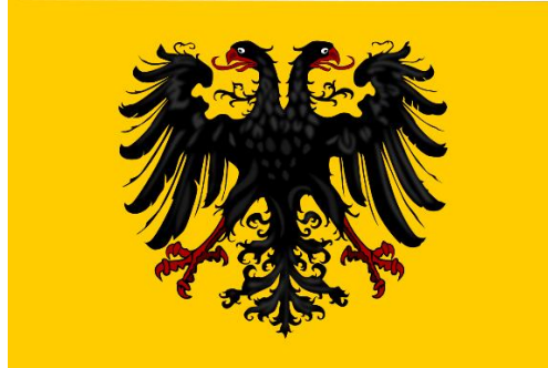
Slika 1. Zastava Svetog Rimskog Carstva