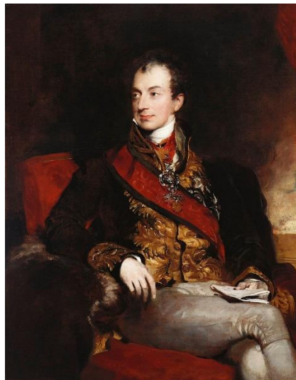
Slika 7. Klemens Wenzel Lothar Metternich