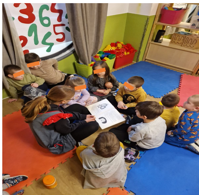
Slika 3. Čitanje teksta na čakavici