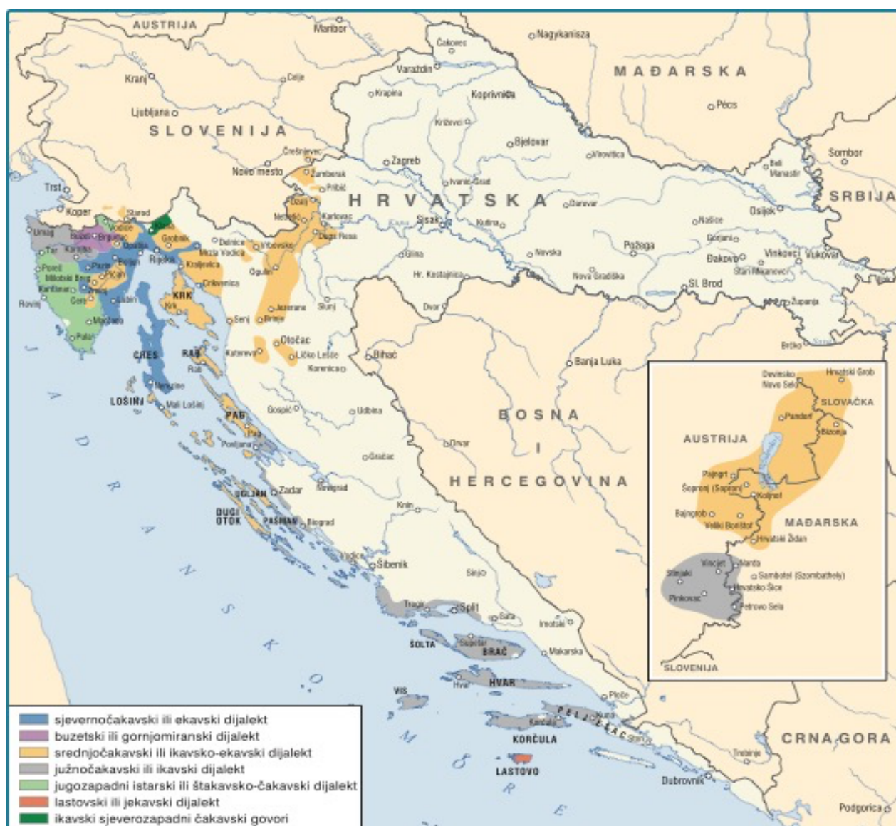
Slika 1. Rasprostranjenost čakavštine