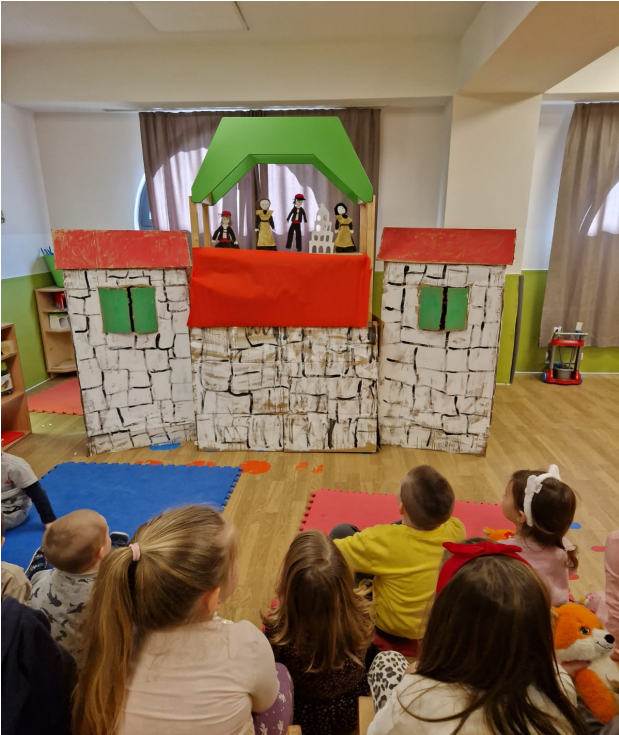
Slika 13. Animacija lutaka