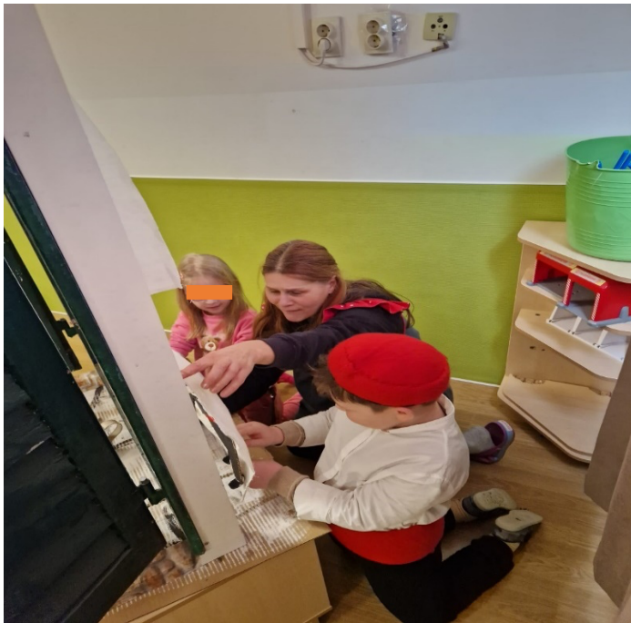
Slika 2. Scensko uvježbavanje

divojko i Dvi gitare i jedna mandolina 31 . Koreografija za Splitske plesove pojednostavila se i prilagodila djeci, a uzor je bio videoprikaz izvedbe KUD-a Jedinstvo 32 . Splitske narodne nošnje napravljene su prema slikama na mrežnoj stranici narodni.NET 33 .