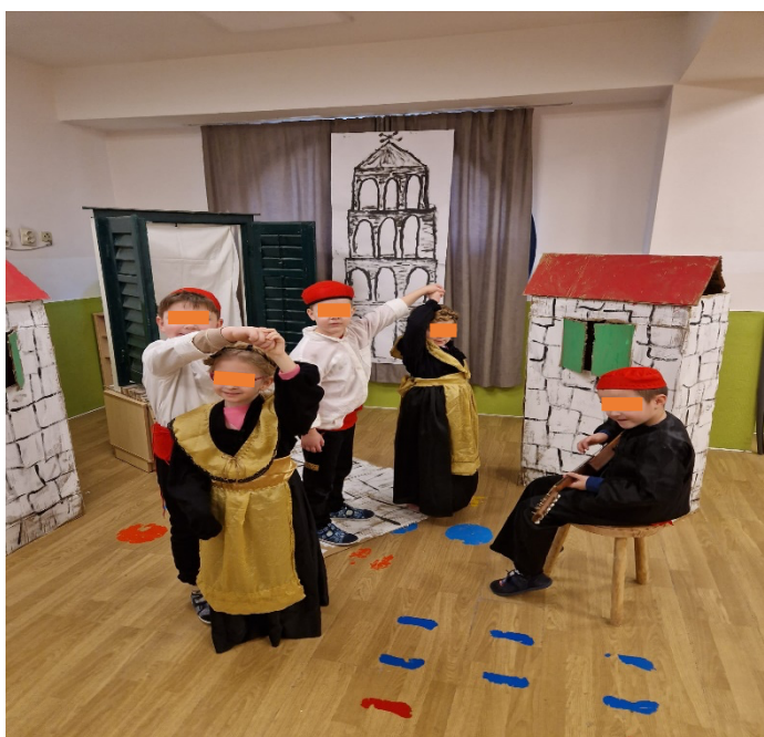
Slika 27. Plesanje Splitskih plesova

SUDJELUJU: U ovoj aktivnosti sudjelovalo je petero djece, od toga tri dječaka (6, 6,5 i 6,7 godina) i dvije djevojčice (5 i 6 godina).