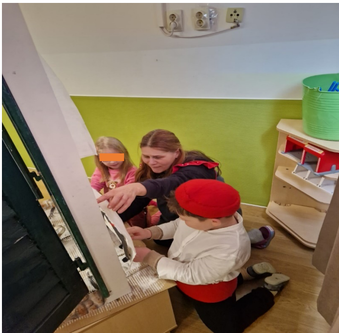
Slika 2. Scensko uvježbavanje

divojko i Dvi gitare i jedna mandolina 31 . Koreografija za Splitske plesove pojednostavila se i prilagodila djeci, a uzor je bio videoprikaz izvedbe KUD-a Jedinstvo 32 . Splitske narodne nošnje napravljene su prema slikama na mrežnoj stranici narodni.NET 33 .