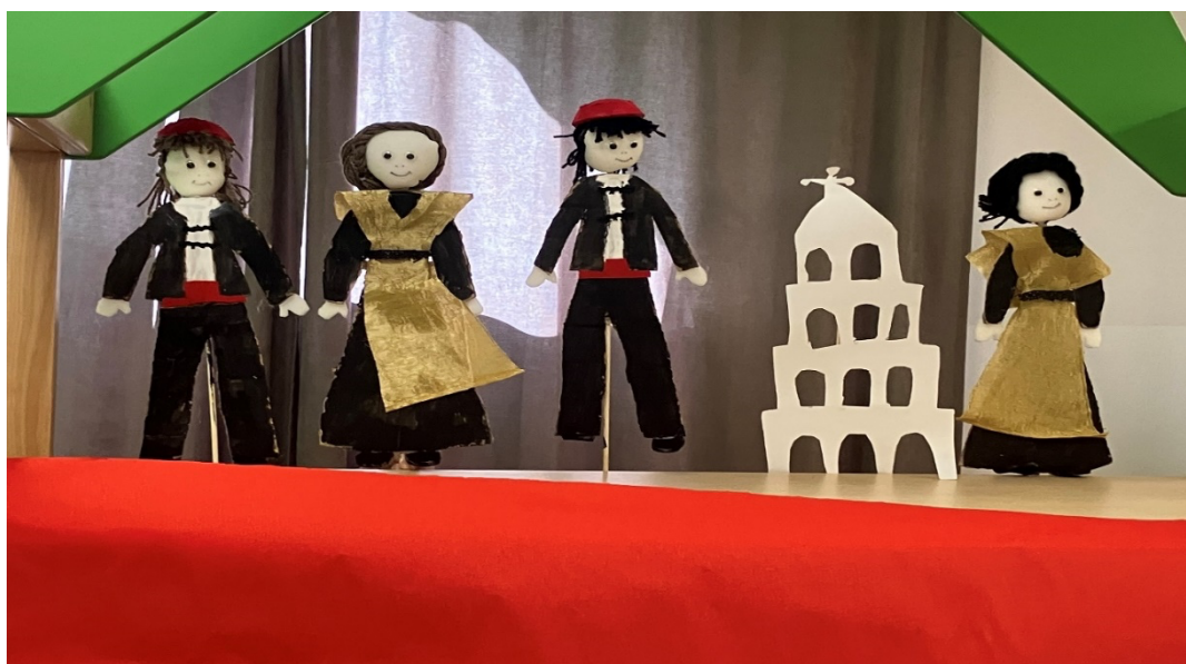
Slika 12. Animacija lutaka

Dječak III.: Split mi je u duši i ništa kontra Splita.