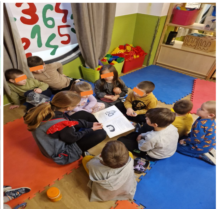
Slika 3. Čitanje teksta na čakavici