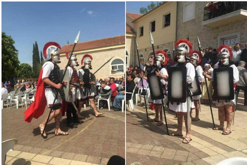
Košučki žudije, Vodice, 2022.

Stomorije u Kaštel Novome, u župi u Žeževici, tako odemo tim župama da uveličamo slavlje. Kad nastupamo mi ne pričamo, ne bacamo se, nema vike. Glavni nastup je na bdijenje na Veliku subotu, Isus je uskrsnuo i mi smo pripadnuti, ne znamo di ćemo sa sobom jer smo mi izdali Isusa, razapeli ga, pripali smo se šta smo to napravili. Većina žudija se bacaju jedni po drugima, trču po crkvi, lome koplja. A mi imamo opremu tešku čak jedanaest i po kilograma na sebi i ne smimo se bacat. Usvojili smo zakon u crkvi da bi najbolje bilo da se Isusu u crkvi jednostavno samo poklonimo. Svatili smo da smo ga razapeli, da smo ga ubili, da smo pogriješili i onda se samo na “Slavu” malo uznemirimo zbog toga što smo napravili i onda se poklonimo, skinemo kacige, spustimo koplja. Tako stojimo dok ne završi “Slava”, a onda pognutih glava s kacigama u ruci i spuštenih koplja izađemo i napustimo crkvu. To su naši načini tijekom Velikog tjedna.” 59