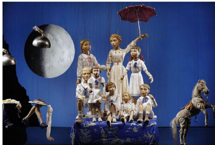
Slika 1. Primjer marionete

najsličnijom čovjeku među svim drugim lutkarskim vrstama. Osnovni je materijal za njezinu izradu drvo, ali u suvremenome kazalištu može biti načinjena i od žice, pluta ili plastične mase (Ivanušić, 2012). Ginjol lutka (Slika 2) je popularna vrsta marionetske lutke s bogatom tradicijom koja seže stoljećima te koja je postala simbol radničke klase i često upotrebljavana za satiru i komentiranje društvenih nepravdi kroz komične predstave (Tomanek, 2018). Javanka lutka (Slika 3) se pojavljivala, iako rijetko, još prije Drugoga svjetskog rata, na pozornicama čeških lutkarskih kazališta masovno je zavladała potkraj četrdesetih godina. Glavu na štapu drži ruka koja istodobno oblikuje tijelo lutke, dok se u orijentalnom uzoru štap pruža ispod donjeg dijela lutke. Rukama se upravlja pomoću štapića koji su ili slobodno privezani za dlanove ili umetnuti u uskom prorezu ruke kako bi se na ruku lutke mogao prenositi i rotacijski pokret i činiti široke lepršave geste. Inače, javanka po pozornici ne hoda, nego „klizi“, a kao lutka uvijek je pripadala iluzivnim lutkama, gdje su animatori skriveni iza paravana ili u propadilištu (Tomanek, 2018).