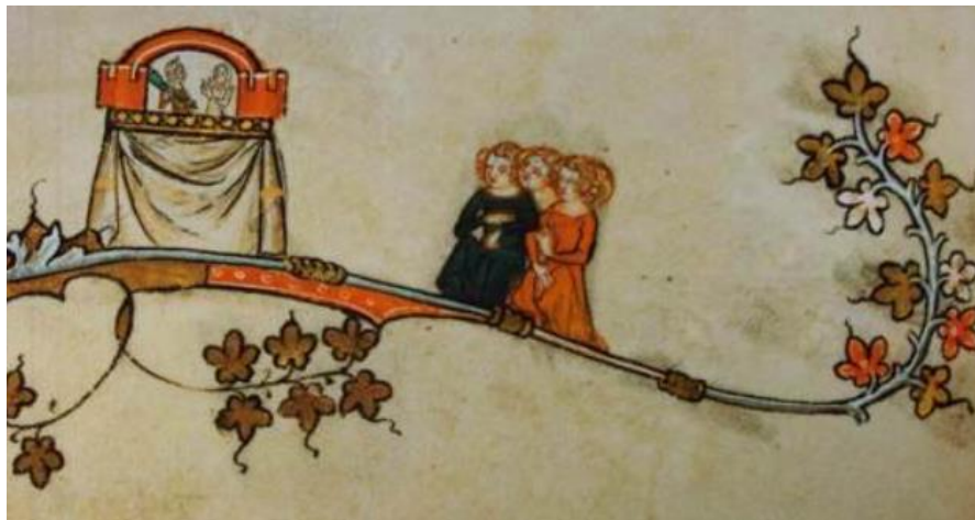
Slika 5. Tri žene gledaju lutkarsku predstavu. Na temelju zapisa u knjižnici Bodleian.

U srednjem vijeku (Slika 5), lutke su se koristile u crkvenim ceremonijama i svetkovanama, često kao dijelovi moralno-religioznih predstava. Za vrijeme renesanse lutkarstvo se počelo razvijati kao zasebna umjetnička forma s lutkarskim pozornicama i glumačkim izvedbama. U 16. stoljeću lutkarstvo je, pak, postalo popularno u cirkusima i sajmovima diljem Europe (Jurkowski, 2005).