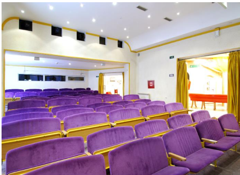
Slika 12. Gradsko kazalište lutaka Rijeka