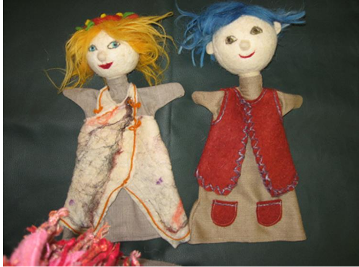
Slika 2. Primjer ginjol lutke