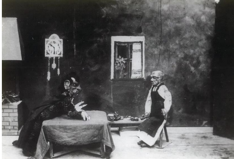
Slika 8. Teatar marioneta — August Šenoa, Postolar i vrag

U 20. stoljeću lutkarstvo je dobilo na profesionalnosti i organiziranosti, osnovali su se prvi profesionalni lutkarski ansambli i kazališta, poput Hrvatskog narodnog kazališta u Zagrebu koje je 1920. godine pokrenulo prve profesionalne lutkarske predstave. Zagrebačko kazalište lutaka (Slika 9) osnovano je 1948. godine kao Zemaljsko kazalište lutaka, proizašlo iz djelovanja dotadašnje Družine mladih, a riječ je o glumačkoj družini osnovanoj 1939. godine, koja predstavlja zaseban pravac lutkarstva u Zagrebu, a vodili su ju Vlado Habunek i Radovan Ivšić. Od osnutka do kraja Drugog svjetskog rata Družina je izvela niz zapaženih avangardnih predstava pretežno francuskih pisaca (Molière, Scapinove spletke i Ljubomorni Barbouillé ), a na repertoaru su i neke lutkarske predstave (A. P. Čehov, Diplomat ) u tehnici ginjola (Verdonik, 2008).