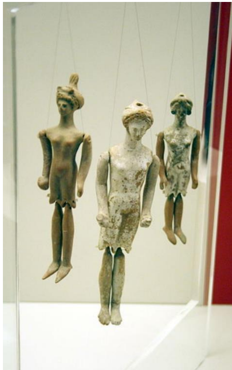
Slika 4. Starogrčka lutka od terakote, 5./4. st. pr. Kr., Nacionalni arheološki Muzej, Atena

Povijest lutkarstva u Europi obuhvaća bogatu raznolikost stilova, tehnika i utjecaja kroz različite epohe i kulture te seže u daleku prošlost. Početcima lutkarstva smatraju se rituali i ceremonije u čast bogova kada se inzistiralo na želji da se imitira život, ali i djela i patnja bogova. Općenito se smatra da se europsko kazalište razvilo u Grčkoj (Slika 4) iz rituala u čast Dioniza, boga vina i plodnosti, a u djelima antičkih filozofa Platona i Aristotela također postoje neki zapisi o lutkarstvu. Nakon raspada Rimskog Carstva tradiciju lutkarstva su njegovale putujuće družine . Lutke su bile smatrane kuriozitetima i znanstvenici ih nisu smatrali značajnim kulturnim fenomenom, a kroničari i povjesničari dugo nisu pokazivali zanimanje za lutkarstvo, koje je općenito smatrano minornim zabavnim žanrom nižih klasa (Jurkowski, 2005).