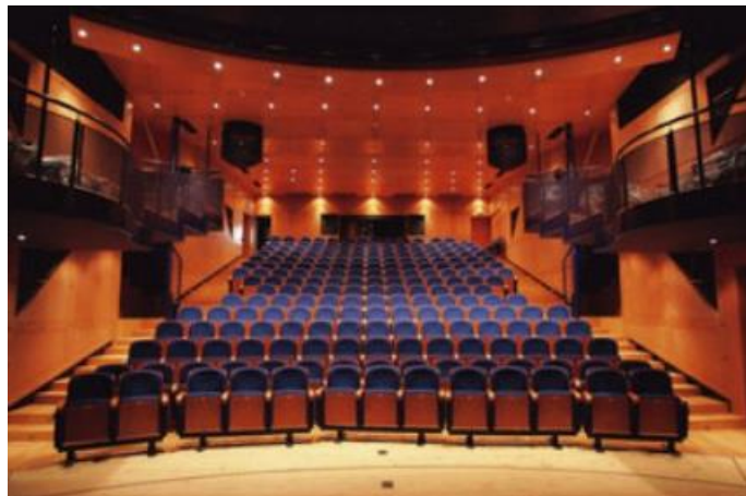
Slika 9. Zagrebačko kazalište lutaka

U 20. stoljeću lutkarstvo je dobilo na profesionalnosti i organiziranosti, osnovali su se prvi profesionalni lutkarski ansambli i kazališta, poput Hrvatskog narodnog kazališta u Zagrebu koje je 1920. godine pokrenulo prve profesionalne lutkarske predstave. Zagrebačko kazalište lutaka (Slika 9) osnovano je 1948. godine kao Zemaljsko kazalište lutaka, proizašlo iz djelovanja dotadašnje Družine mladih, a riječ je o glumačkoj družini osnovanoj 1939. godine, koja predstavlja zaseban pravac lutkarstva u Zagrebu, a vodili su ju Vlado Habunek i Radovan Ivšić. Od osnutka do kraja Drugog svjetskog rata Družina je izvela niz zapaženih avangardnih predstava pretežno francuskih pisaca (Molière, Scapinove spletke i Ljubomorni Barbouillé ), a na repertoaru su i neke lutkarske predstave (A. P. Čehov, Diplomat ) u tehnici ginjola (Verdonik, 2008).