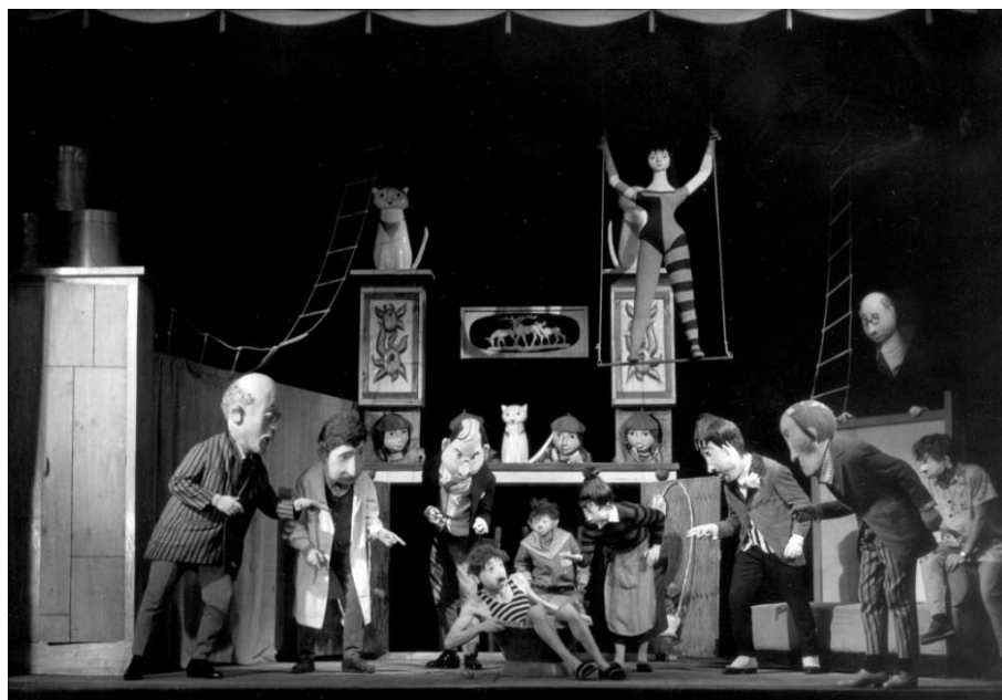
Slika 6. Patnja Piotra Oheya, 1959.

Poljska (Slika 6) i Rumunjska, a kasnije su im se pridružile i Bugarska i Mađarska (Ivanušić, 2012).