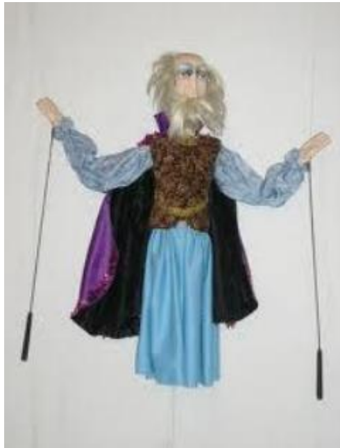
Slika 3. Primjer javanke lutke