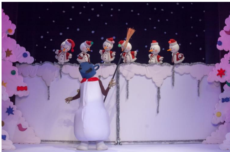
Slika 15. Bijele kočije