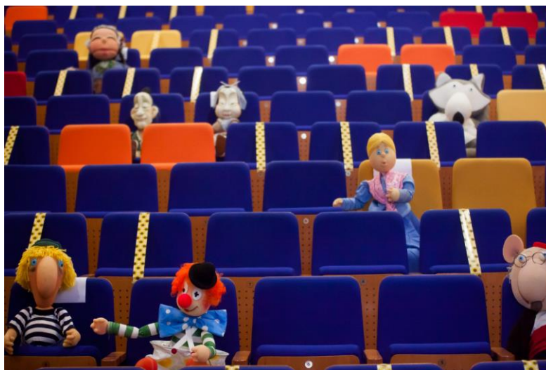
Slika 14. GKL Split