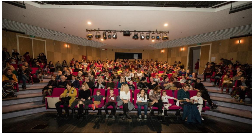
Slika 10. Zadarsko lutkarsko kazalište