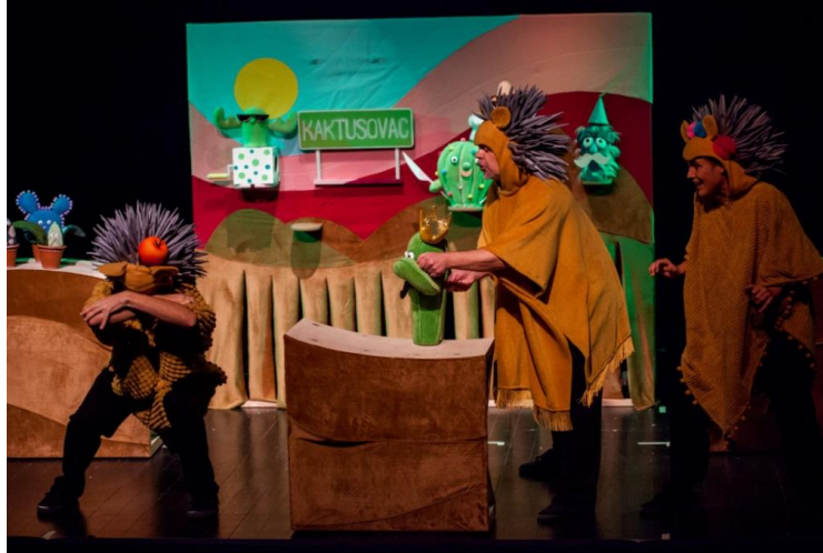
Slika 17. Kaktus bajka