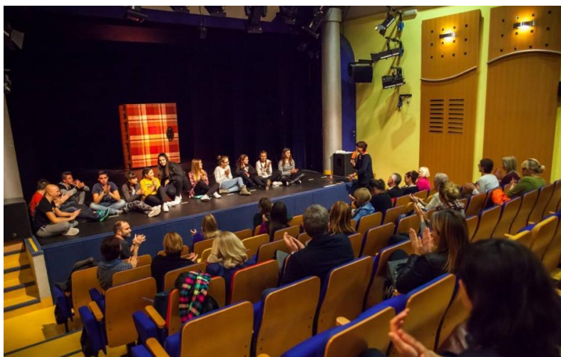
Slika 13. GKL Split

je i izboriti se za vidljivost djeteta u društvu i njegovo pravo na umjetnički kvalitetno, vrhunsko kazalište koje statusno ne smije biti u lošijem položaju od kazališta za odraslu publiku. 1