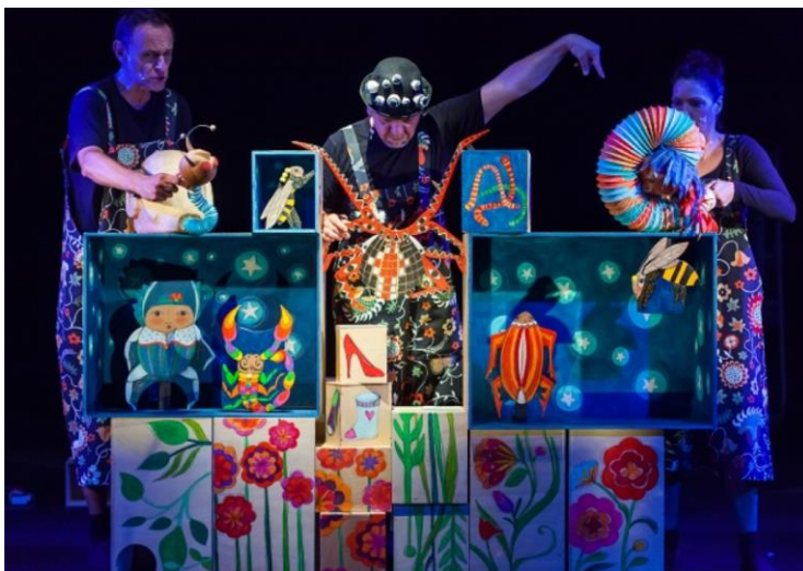
Slika 16. Stonoga Goga