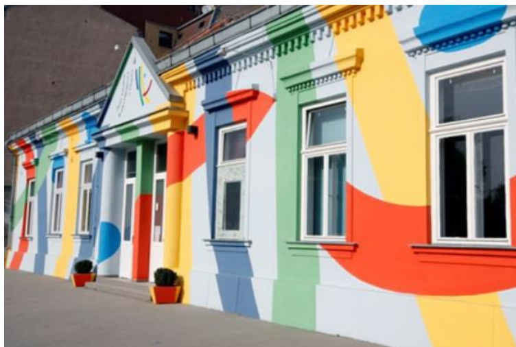
Slika 11. Dječje kazalište Branka Mihaljevića Osijek