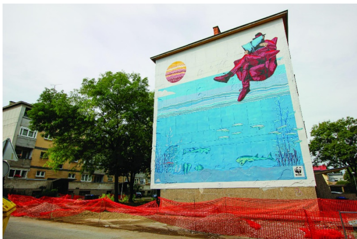
Slika 27: Daj ribi šansu