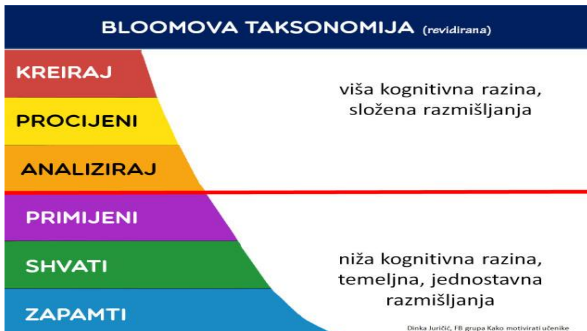
Slika 2 Sažeti prikaz revidirane Bloomove taksonomije (prema Juričić, 2015, Web. 1.9.2016.)

U misaone operacije nižeg reda svrstavaju se operacije koje ne zahtijevaju veliki mentalni napor, poput radnji dosjećanja i razumijevanja. Kreativnost spada u red operacija viših kognitivnih razina budući da se ono ubraja u složeno razmišljanje (Nemeth – Jajić, 2007), uz napomenu da u nastavi engleskog jezika se koristi strani jezik što automatski čini proces dodatno složenijim.