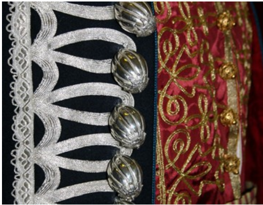
Slika 10. Svečana odjeća 66

U ruci puška kremenjača naslonjena na lijevo rame. Na nogama lagani opanci, a u njima vezeni terluci. Bubnjari, trubači, namještač alke i njegov pomoćnik, obučeni su u jednostavniju narodnu nošnju s crvenom kapom urešenom kitama. Članovi časnog suda obučeni su u svečana tamnopalva odijela s plavom vrpcom na prsima. 65