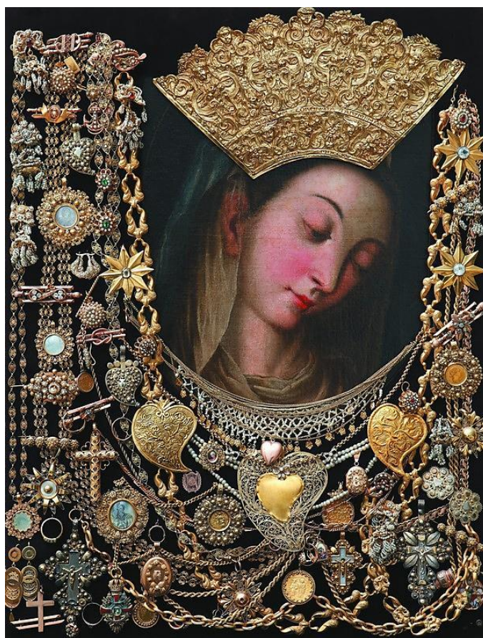
Čudotvorna Gospa Sinjska

dogodila u čudesnim okolnostima. Mali broj branitelja (oko 700) uspio se oduprijeti nadmoćnoj osmanlijskoj vojsci (40.000 do 60.000 vojnika). Uspjeh obrane pripisali su Božjoj pomoći koju su branitelji i narod izmolili pred slikom Majke od milosti, kako se tada nazivala slika Gospe Sinjske. Kao spomen na slavnu Gospinu pobjedu, uvedena je u Sinju viteška igra Alka. Također, u čast pobjede, Gospina je slika okićena zlatnom krunom s križem. Na dnu krune je upisano In perpetuum coronata triumphat – anno MDCCXV (Zauvijek okrunjena slavi – 1715.) 70 Velik broj hodočasnika Gospi Sinjskoj doslovno hodo-časti, tj. dolazi pješice. Mnogi na zavjet dolaze bosu, iz dalekih krajeva.