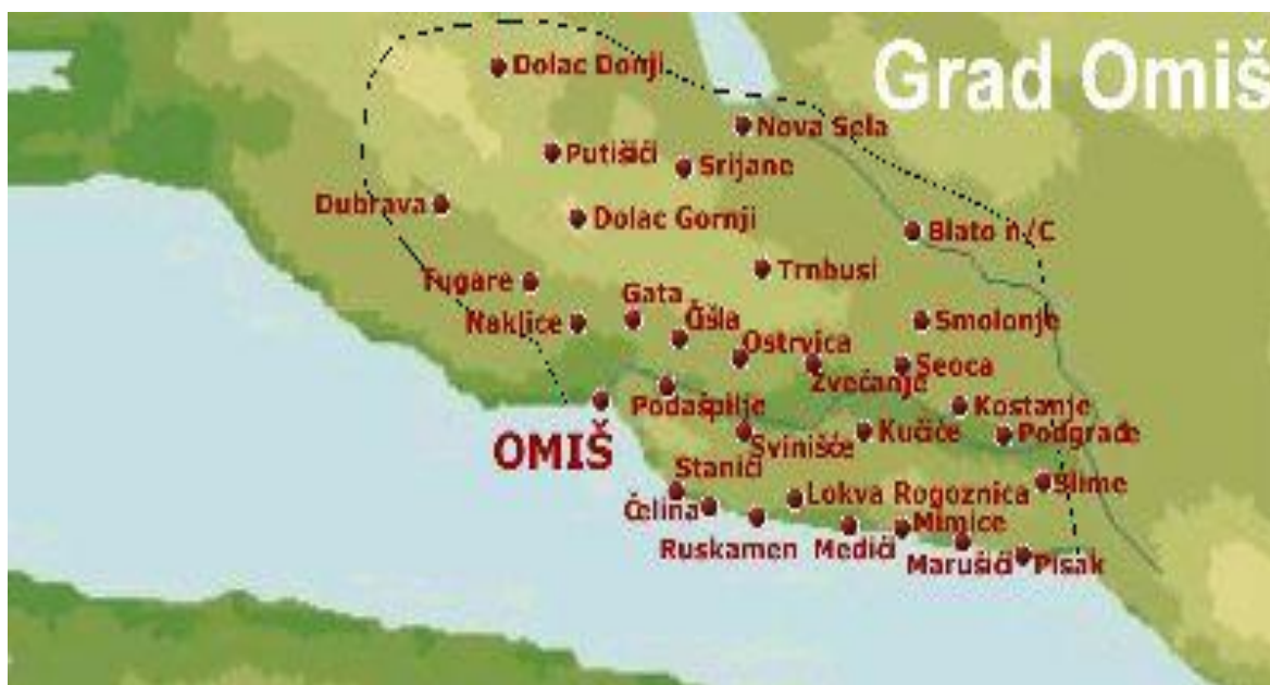
Slika 1. Omiška rivijera

Šire omiško područje obuhvaća Omiško primorje i Zagoru, a proteže se od ušća rijeke Žrnovnice kraj Stobreča pa sve do prijevoja Dubci (Vrulja), dok ga sa sjeverne strane omeđuje rijeka Cetina. 4 U sastavu grada Omiša danas se nalaze naselja: Blato na Cetini, Borak, Čelina, Čišla, Donji Dolac, Dubrava, Gata, Gornji Dolac, Kostanje, Kučiće, Lokva Rogoznica, Marušići, Mimice, Naklice, Nova Sela, Omiš, Ostrvica, Pisak, Podašpilje, Podgrađe, Putišići, Seoca, Slime, Smolonje, Srijane, Stanići, Svinišće, Trnbusi, Tugare, Zakućac i Zvečanje 5 (slika 1). Najveći dio tog prostora u prošlosti je pripadao autonomnoj općini Poljica.