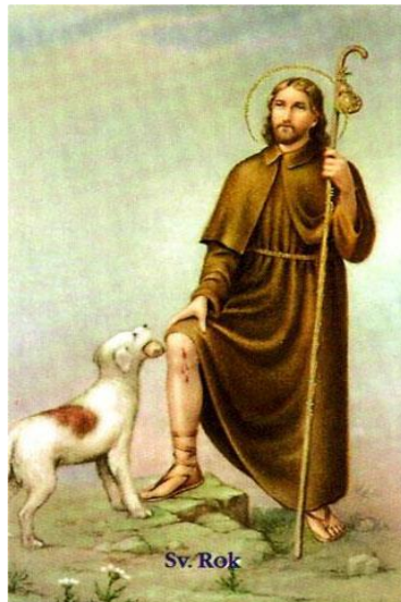
Slika 2 Sveti Roko i pas

pustit tu ženu u Supetar, cilo misto bila bi okružila ta kuga, sveti Roko koji čuva od bolesti, od kuge, i bi bi pomro cili Supetar. Al on je to vroti nose i onda je tako poštedi Supetar od kuge. A sveti Roko je jema tega kućina, koji je s njin u njegove dane u pustinji sta, i pas mu je nosi jist. Onda pas ima u usta jedan komad ka pogače, ka kruha, to je znak kako je on nosi u pustinju svetome Roku jist. 119