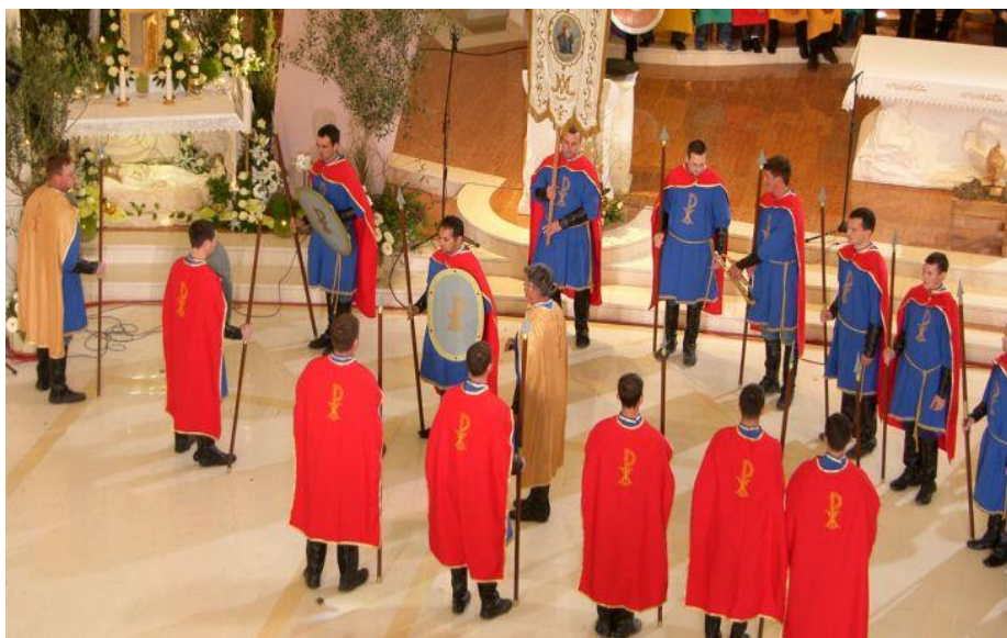
Slika prikazuje Selačke žudije

Ovo čini i dio Uskrasnih običaja u Selcima, žudije , čuvari Božjeg groba koji na Veliku subotu navečer kod pjevanja Slave padaju „slobodnim padom na pod.“ Nakon toga vojnici bi istrčali iz crkve kao da prikazuju vojnike prestrašene od Isusova uskrsnuća.