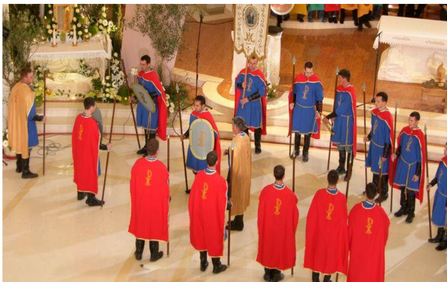
Slika prikazuje Selačke žudije

Ovo čini i dio Uskrasnih običaja u Selcima, žudije , čuvari Božjeg groba koji na Veliku subotu navečer kod pjevanja Slave padaju „slobodnim padom na pod.“ Nakon toga vojnici bi istrčali iz crkve kao da prikazuju vojnike prestrašene od Isusova uskrsnuća.