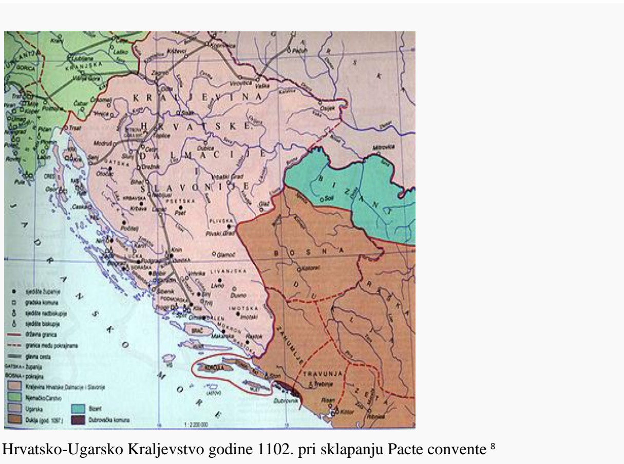
Hrvatsko-Ugarsko Kraljevstvo godine 1102. pri sklapanju Pacte convente 8

je jaku vojsku koja se mogla uzdržavati samo teritorijalno, pa je Koloman sve zemljišne posjede, koji već nisu bili u posjedu slobodnih seljaka ili vlastelina, davao vojnicima u zamjenu za vojnu obvezu. Hrvatsko plemstvo se također feudalizira i nestaju stare strukture hrvatskog plemstva županijskog ustrojstva a javlja se novi oblik sa sudskom, upravnom i gospodarstvenom ovlasti. Mađarski kraljevi su imenovali hrvatskog bana, dijelili su donacije vlastelinima, potvrđivali zakone donesene na hrvatskom i slavonskom saboru i zapovijedali udruženom ugarsko-hrvatskom vojskom. Hrvatski ban je imao obvezu upravljanja administracijom, sudstvom, financijama i predvodio je hrvatsku vojsku u ratovima. Pojedine su se obitelji, zahvaljujući donacijama, toliko osilile i na taj način uvažavale i jak politički utjecaj (krčki i blagajski knezovi, bibrirski Šubići, cetinjski Nelipići, omiški Kačići, krbavski Kurjakovići). Slijedi slika koja pokazuje tadašnju podijelu Hrvatske.