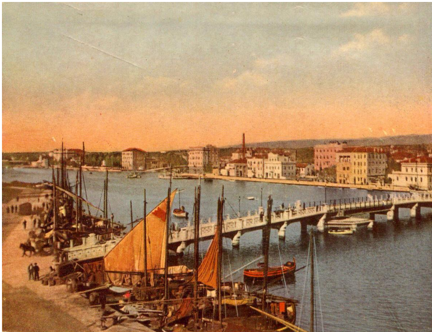
Zadar u prošlosti

osvojiti iako su u nekoliko navrata napadali Zadar. 69 Krajem osamnaestoga stoljeća pripao je Austriji, zatim je kratko bio pod vlašću Francuza da bi opet dospio u ruke Austrije koja ga je pripojila Dalmaciji čijim je glavnim gradom postao. U devetnaestome stoljeću i Zadar su zahvatile preporodne aktivnosti od čega valja izdvojiti časopis Zora Dalmatinska koji se zalagao za sjedinjenje Dalmacije s Hrvatskom. Godine 1905. zastupnici iz Dalmacije i Slavonije pridružili su se politici novoga kursa na temelju Zadarske rezolucije kojom se zahtijevala što veća unutrašnja sloboda i vanjska samostalnost i Ugarske i Hrvatske čime bi se Dalmacija sjednila s Hrvatskom. Zadar je 1918. godine okupiran od strane talijanske vojske i Rapalskim je ugovorom predan Italiji. Matičnoj je zemlji pripao 1944. godine.