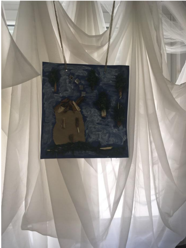
Slika 16 Izlaganje radova "Kuća"