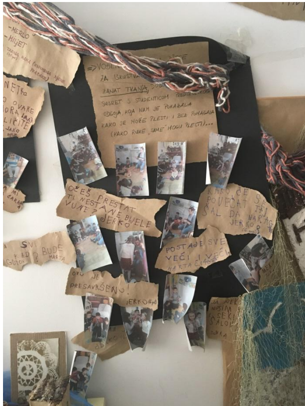
Slika 12 Izjave djece na temu "Kukičanje"