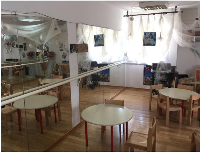
Slika 1. Ogledala u sobi dnevnog boravka

U Reggio koncepciji posebnu se važnost daje uređenju prostora, počevši od njegovih boja do osvjtljenja. Prostor je organiziran tako da se omogućuje djetetu slobodno kretanje i izražavanja kreativnosti na stotinu načina.