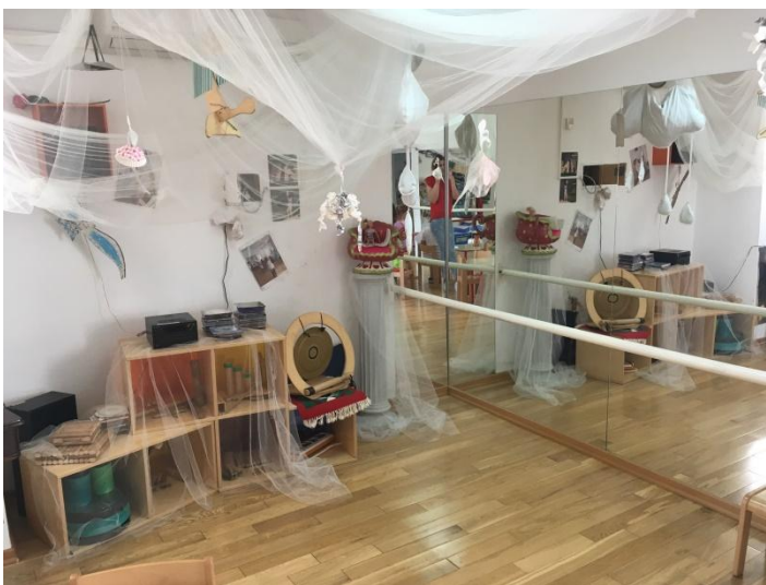
Slika 2 Glazbeni centar